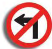
R.4. (a) NO GIRAR A LA IZQUIERDA