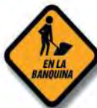
T. 8 HOMBRES TRABAJANDO EN LA BANQUINA