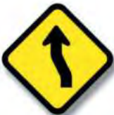
R.7. (b) CURVA (contracurva)