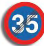
R.32 FIN DE LA PRESCRIPCION (Ej)