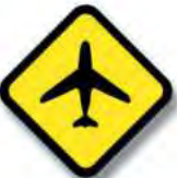
R.28 CORREDOR AEREO