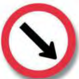
R.22 (a) PASO OBLIGADO (derecha)