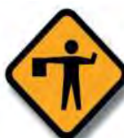
T. 5 BANDERILLERO