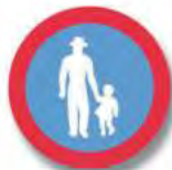
R.18. (e) CIRCULACION EXCLUSIVA (peatones)