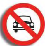
R. 3 (1) PROHIBICION DE CIRCULAR (auto)