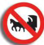
R. 3 (7) PROHIBICION DE CIRC. (tracc. sang.)