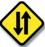
R.23 INICIO DE DOBLE CIRCULACION