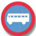
R.18 (a) CIRCULACION EXCLUSIVA (transp. público)