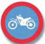
R.18. (b) CIRCULACION EXCLUSIVA (moto)