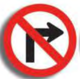
R.4. (b) NO GIRAR A LA DERECHA