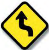
R.7. (c) CURVA (en «S»)