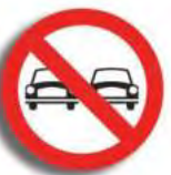
R. 6 PROHIBICION ADELANTAR