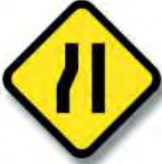
R.10. (b) ESTRECHAMIENTO (en una sola mano)