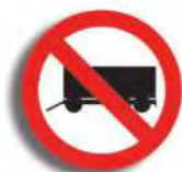
R. 3 (5) PROHIBICION DE CIRC. (acoplado)