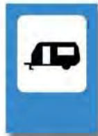
ESTACIONAMIENTO DE CASAS RODAN- TES