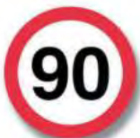
R. 15 LIMITE DE VELOCI- DAD MAXIMA