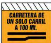
T. 3 CARRETERA DE UN SOLO CARRIL