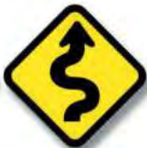
R.8 CAMINO SINUOSO