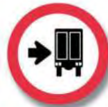
R. 23 TRANSITO PESADO A LA DERECHA