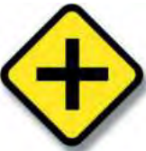
R.24. (a) ENCRUCIJADA (cruce)