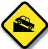
R.9. (a) PENDIENTE (descendiente)