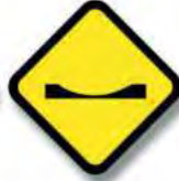
R.11. (b) PERFIL IRREGULAR (badén)