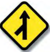
R.22 INCORPORACION DE TRANSITO LATERAL