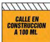
T. 1 CALLE O CARRETERA EN CONSTRUCCION O CERRADA