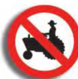
R. 3 (10) PROHIBICION DE CIRC. (tractor)