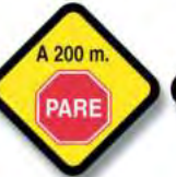
R.33 (a) PROXIMIDAD SEÑAL RESTRICTIVA (pare)