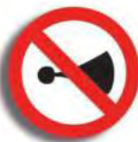
R. 7 NO RUIDOS MOLESTOS