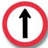
R.21 (c) SENTIDO DE CIRCULACION (com. sent. único)