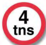
R.11. (a) LIMITACION DE PESO