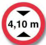
R. 12 LIMITACION DE ALTURA