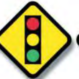
R.32 PROXIMIDAD DE SEMAFORO