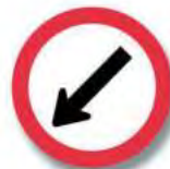
R.22 (b) PASO OBLIGADO (izquierda)