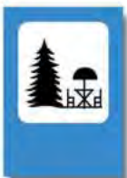
LUGAR PARA RECREACION Y DESCANSO