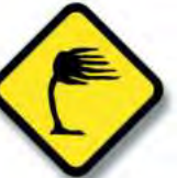
R.30 VIENTOS FUERTES LATERALES