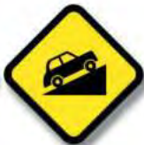
R.9. (b) PENDIENTE (ascendiente)