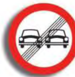
R.31 FIN DE LA PRESCRIPCION (Ej)