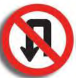
R. 5 NO GIRAR EN «U» (no retomar)