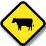
R.27. (a) ANIMALES SUELTOS (vaca)