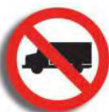
R. 3 (4) PROHIBICION DE CIRC. (camión)