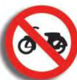
R. 3 (3) PROHIBICION DE CIRCULAR (moto)