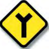
R.24. (c) ENCRUCIJADA (bifurcación)