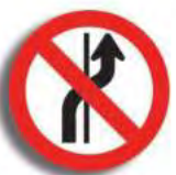
R. 10 PROHIBICION DE CAMBIAR DE CARRIL