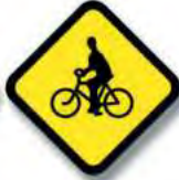
R.26 (a) CICLISTA