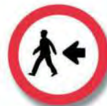
R. 24 PEATONES POR LA IZQUIERDA