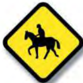
R.26 (b) JINETES