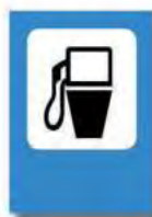
ESTACION DE SERVICIO