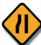
T. 4 ESTRECHAMIENTO DE CALZADA