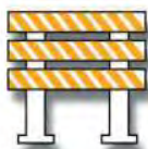
VALLAS (B) TIPO (III)