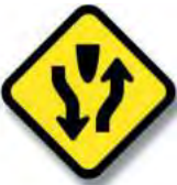
R.20 CALZADA DIVIDIDA