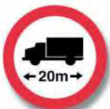
R. 14 LIMITACION DEL LARGO DEL VEHI- CULO