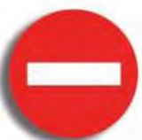
R. 2 CONTRAMANO