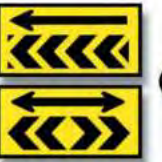
R.31 FLECHA DIRECCIONAL