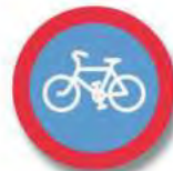
R.18. (c) CIRCULACION EXCLUSIVA (bicicleta)