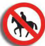
R. 3 (8) PROHIBICION DE CIRC. (animal)