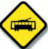
R.29 (a) PRESENCIA DE VEHICULO EXTRAÑO (tranvía)