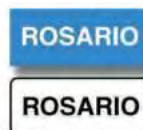
I. 5 IDENTIFICACION DE REGION Y LOCALIDAD