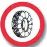
R. 19 USO DE CADENAS PARA NIEVE