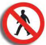
R. 3 (6) PROHIBICION DE CIRC. (peatón)