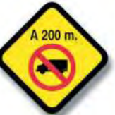
R.33 (c) PROXIMIDAD SEÑAL RESTRICTIVA (otras)