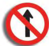
R. 1 NO AVANZAR