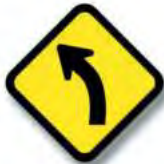
R.7. (a) CURVA (común)