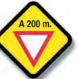
R.33 (b) PROXIMIDAD SEÑAL RESTRICTIVA (paso)