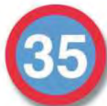
R. 16 LIMITE DE VELOCI- DAD MINIMA