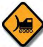
T. 7 EQUIPO PESADO EN LA VIA