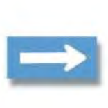
R.21 (d) SENTIDO DE CIRCULACION (alternativa)