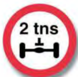
R.11. (b) LIMITACION DE PESO