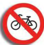
R. 3 (2) PROHIBICION DE CIRC. (bicicleta)