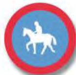
R.18. (d) CIRCULACION EXCLUSIVA (jinete)