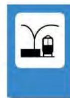
TERMINAL DE FERROCARRIL