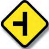
R.24. (b) ENCRUCIJADA (empalme)