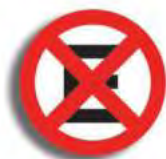
R. 9 NO ESTACIONAR NI DETENERSE