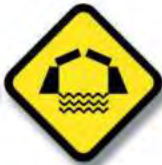
R.17 PUENTE MOVIL