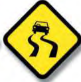
R.12 CALZADA RESBALADIZA