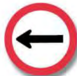
R.21 (b) SENTIDO DE CIRCULACION (izquierda)