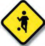
R.25 (b) NIÑOS