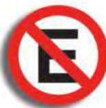
R. 8 NO ESTACIONAR