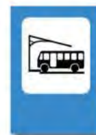
TERMINAL DE OMNIBUS