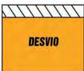
T. 2 DESVIO