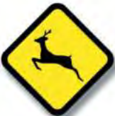
R.27. (b) ANIMALES SUELTOS (ciervo)