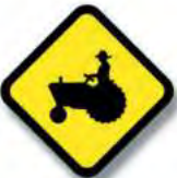
R.29 (b) PRESENCIA DE VEHICULO EXTRAÑO (tractor)