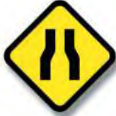
R.10. (a) ESTRECHAMIENTO (en las dos manos)