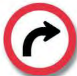
R.20 (a) GIRO OBLIGATORIO (derecha)