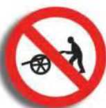
R. 3 (9) PROHIBICION DE CIRC. (carro mano)