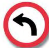
R.20 (b) GIRO OBLIGATORIO (izquierda)