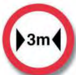
R. 13 LIMITACION DE ANCHO