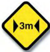
R.19 ANCHO LIMITADA