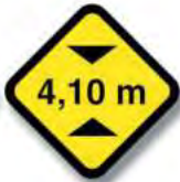
R.18 ALTURA LIMITADA