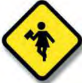
R.25 (a) ESCOLARES