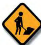
T. 6 HOMBRES TRABAJANDO