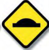
R.11. (c) PERFIL IRREGULAR (lomada)