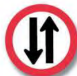
R. 26 COMIENZO DE DOBLE MANO