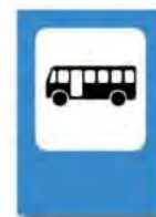
DETENCION TTE. PUBL. PASAJEROS