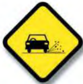
R.13 PROYECCION DE PIEDRAS