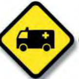
R.29 (c) PRESENCIA DE VEHICULO EXT. (ambulancia)