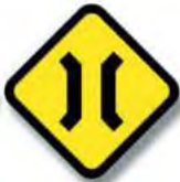
R.16 PUENTE ANGOSTO