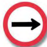
R.21 (a) SENTIDO DE CIRCULACION (derecha)