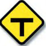
R.24. (c. alt.) ENCRUCIJADA (bifurcación)