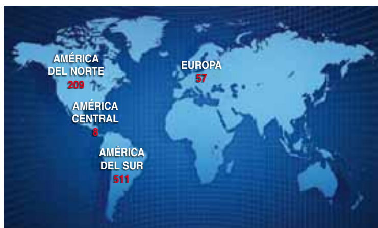
Destino continental de trofeos por cazadores - Temporada 2016

Corresponde a los 785 cazadores que se llevaron piezas de caza de todas las especies. La Caza Mayor en La Pampa es un recurso turístico que atrae a deportistas de todo el país y de distintas latitudes del mundo.