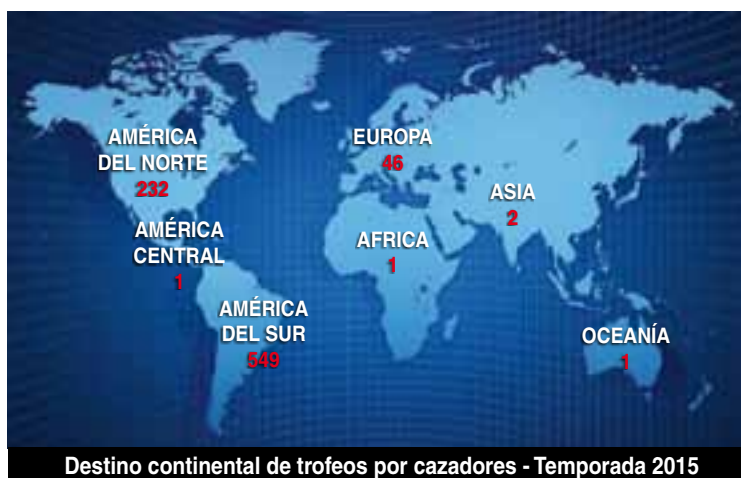
Destino continental de trofeos por cazadores - Temporada 2015

Corresponde a los 832 cazadores que se llevaron piezas de caza de todas las especies. La Caza Mayor en La Pampa es un recurso turístico que atrae a deportistas de todo el país y de distintas latitudes del mundo.