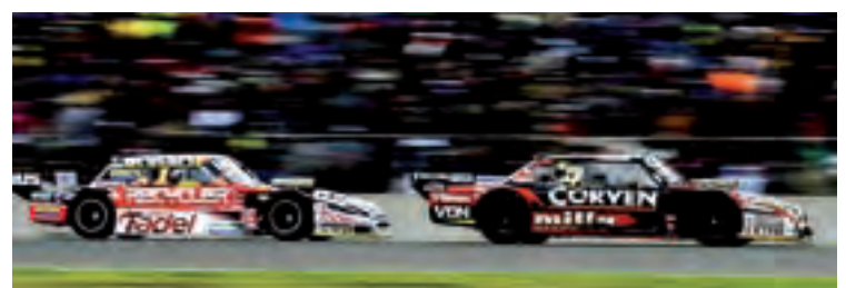
La carrera de La Pampa entregará los 15 referentes que llegarán a la última fecha como integrantes de la Copa de Oro Rio Uruguay Seguros 2022.