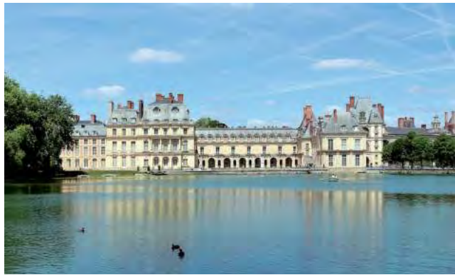
El palacio de Fontainebleau, al sur de París, fue el hogar del Luis XIII, pero más recientemente fue el escenario del videoclip Born to die, de la gran estrella pop Lana del Rey.

Booking.com comparte los destinos detrás de algunos de los videoclips más emblemáticos del mundo: Fontainebleau en Francia, Seúl en Corea del Sur, Budapest en Hungría, Bedford en EEUU y Port Kembla en Australia fueron elegidos por bandas y solistas para darle imagen y color a algunas de sus can-