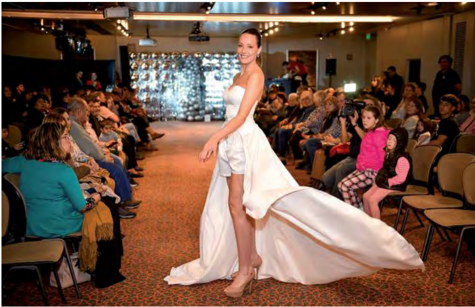
Un clásico de todos los años, "El Alma de la Fiesta" es la única exposición para fiestas y eventos en La Pampa, reuniendo a los principales proveedores y profesionales de este amplio sector.

La novedad de esta edición será el desarrollo del 1er Workshop El Alma de la Fiesta "Capacitarse para CRECER en el negocio de los Eventos y Celebraciones" cumpliendo un gran anhelo