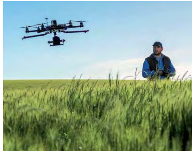
Se trata de una expo específica sobre cereales, que tendrá lugar en el establecimiento La Ballenera, en Miramar, los días 30 y 31 de octubre de este año.

Por primera vez en Argentina se realizará una expo temática diferente, sobre cereales de invierno. Desde la siembra pasando por la genética, la nutrición, protección y el manejo de los