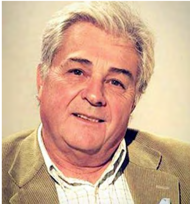
Bertossi es categórico: "Los fueros notariales argentinos de raigambre esencialmente española, se manifiestan, operar e imperan desde remota época colonial".

Se trata de reminiscencias jurisdiccionales privilegiadas de épocas pretéritas, como cuando en la Edad Media un monarca concedía facultades y potestades notariales en una determinada jurisdicción, urbana o rural, consistentes en un conjunto