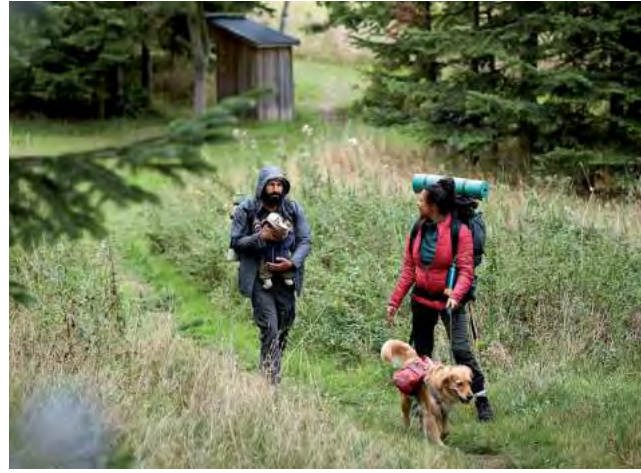
Una parte significativa de los encuestados en Argentina (60%) expresa preocupación personal respecto a los impactos ambientales de los viajes, destacando una conciencia generalizada de los problemas de sostenibilidad dentro de la industria de viajes.

Además, una parte significativa de los encuestados en Argentina (60%) expresa preocupación personal respecto a los impactos ambientales de los viajes, destacando una conciencia generalizada de los problemas de sostenibilidad dentro