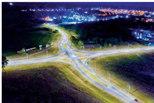
La tarea vial no termina en la pavimentación, incluye señalamiento, obras de arte y muy importante: una buena iluminación led, como se viene realizando en la Provincia.

La Dirección Provincial de Vialidad de La Pampa, nació en 1953, cuando la provincia tenía 40 kms. de pavimento ejecutado. En la actualidad, suma más de 4.000 kms. de rutas provinciales y 1.700 km de rutas nacionales). Recientemente, el Organismo cumplió