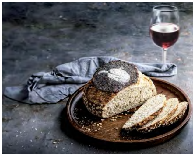
Se trata de dos productos nobles y que se combinan muy bien, pero tienen sus secretos. Cuáles son las recomendaciones de los expertos. Además, cuáles son los beneficios de incorporar masa madre a la dieta.

- Pan negro: este tipo de pan se puede elaborar a partir de la harina de centeno y se pueden sumar semillas de cereales o masa madre tostada para dar al pan notas