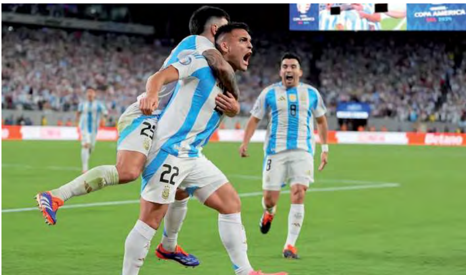
Con gol de Lautaro Martínez contra Chile, la Selección Argentina de fútbol fue la primera en clasificar para los Cuartos de final de esta Copa América USA 2024.

Argentina y Uruguay son entonces, las dos selecciones con mayor cantidad de títulos continentales en su haber hasta el momento, 15 cada una. Le siguen Brasil que se posiciona en el tercer lugar con 9 campeonatos; luego vienen Paraguay, Chile y Perú, con 2 y en último lugar, Colombia y Bolivia con 1 copa en sus vitrinas cada una.