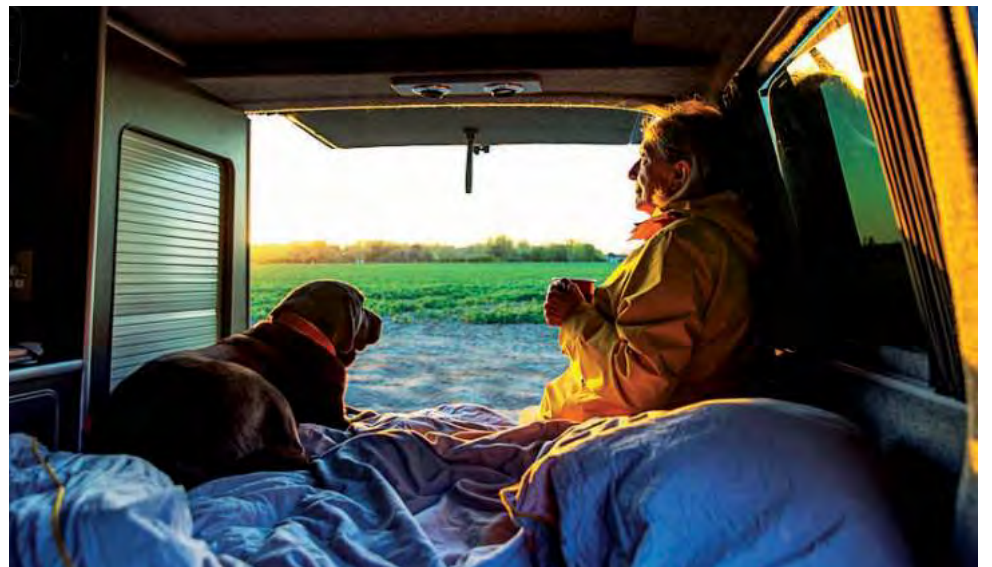
-El 55% reconoce el impacto en el medio ambiente natural, subrayando preocupaciones sobre la preservación de ecosistemas y biodiversidad.