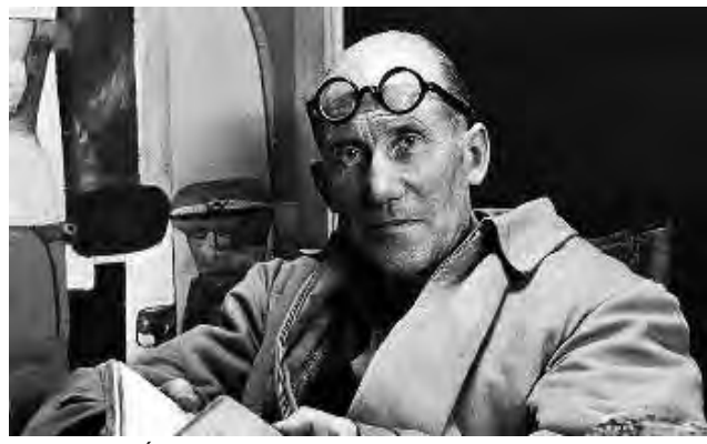
Charles-Édouard Jeanneret-Gris, más conocido como Le Corbusier, definió a la arquitectura como un hecho plástico, el juego sabio, correcto, magnífico, de los volúmenes bajo la luz.

VIENE DE TAPA Desde este punto de vista, aunque los medios de la arquitectura puedan consistir en muros, columnas, forjados, techos y demás elementos constructivos, su fin es crear espacios con sentido donde los seres humanos puedan desarrollar todo tipo de actividades. Es en este “tener sentido” en que puede distinguirse la arquitectura (como arte) de la mera construcción. Así es como ésta es capaz de condicionar el comportamiento del hombre en el espacio, tanto física como emocionalmente. Aunque en la actualidad suele considerarse que la principal actividad de la arquitectura va dirigida al diseño de espacios para el refugio y la habitación (las viviendas), sólo a partir del siglo XIX comenzaron los arquitectos a preocuparse por el problema del alojamiento, la habitabilidad y la higiene de las viviendas, y a ampliar su ámbito de actuación más allá de los monumentos y edificios representativos. La evolución a la especialización y la separación de ámbitos laborales es similar a la de otras profesiones. En los siglos pasados los arquitectos se ocupaban no sólo de diseñar los edificios, sino que también diseñaban