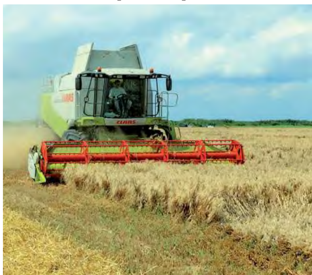
La planificación meticulosa y la implementación de técnicas específicas son fundamentales para garantizar una cosecha exitosa en un clima variable.

Frente a la variabilidad climática, especialistas del INTA ofrecen una guía exhaustiva para optimizar la cosecha de granos, destacando la importancia de la planificación y la adecuación de equipos. El clima impredecible representa un desafío constante para los productores, especialmente durante la crucial etapa de la cosecha de granos. En este escenario, la planificación meticulosa y la implementación de estrategias detalladas se vuelven fundamentales para garantizar una cosecha eficiente y minimizar las pérdidas.