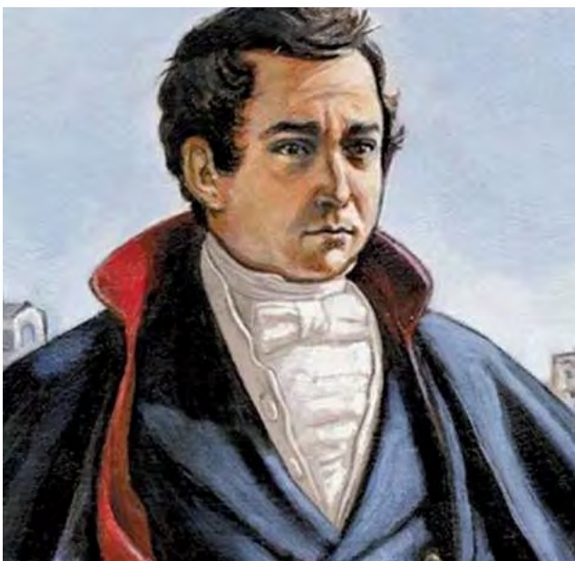
El 7 de junio se recuerda el Día del Periodista en Argentina, en honor a la "Gazeta de Buenos Ayres", primer periódico nacional, de salida semanal, fundado por Mariano Moreno en 1810.

En ese encuentro, además, se dio comienzo a una legislación muy importante, porque se establecieron las bases del Estatuto del Periodista Profesional (ley 12908), sancionada por el Congreso Nacional.