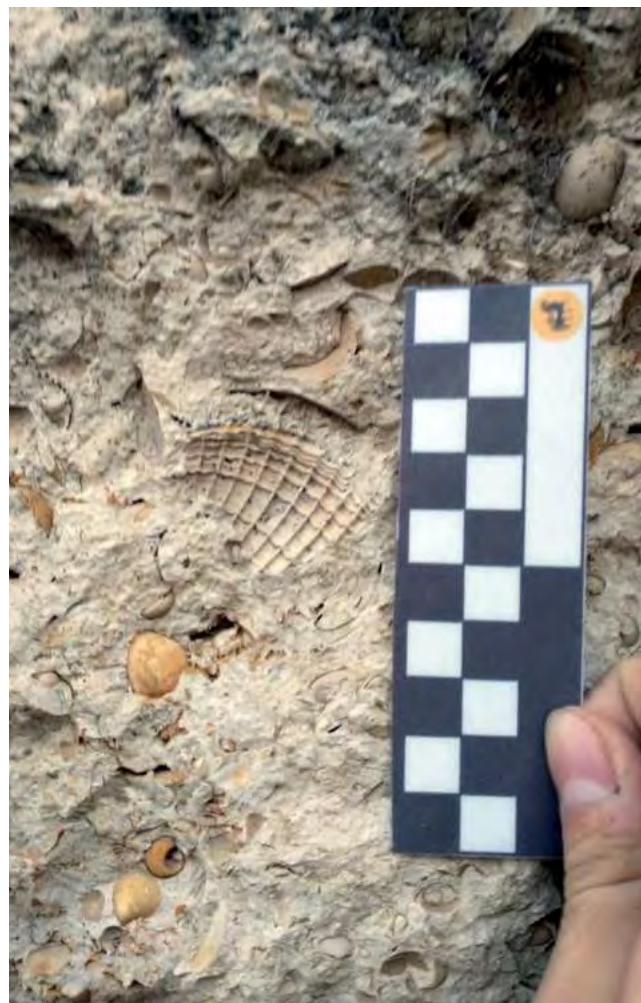
En la recorrida por la ribera se registraron ejemplares fósiles representantes de moluscos bivalvos. Lamentablemente, la zona de estos afloramientos no se encuentra bajo ninguna medida de protección.