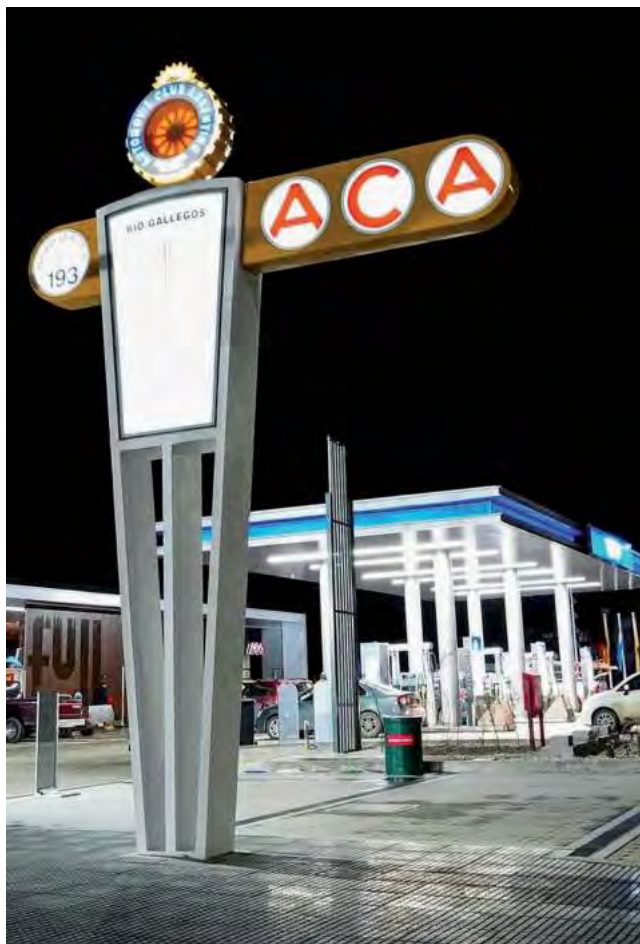
En 1936 cuando el ACA se asoció con YPF, elaboraron un plan para construir 180 estaciones en todo el país, ubicadas a una distancia promedio de 150 kilómetros.

que aún nos falta recorrer, valoramos la fidelidad de nuestros asociados, la vocación servicial de nuestro personal puesta siempre al cuidado del socio y las empresas concesionadas y sus trabajadores que contribuyen día a día para que esta Institución lleve a cabo su labor”.