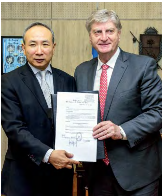
El gobernador de La Pampa, Sergio Ziliotto, junto al embajador de China en Argentina, Wang Wei.

sión se concentra en el sector energético, sin embargo, se están explorando activamente oportunidades de inversión en otros sectores, como las comunicaciones, servicios e industrias. Esta estrategia diversificada busca aprovechar el potencial de crecimiento en distintos ámbitos económicos pampeanos.