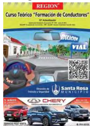
Última edición -15ta- de la revista “Curso Teórico Formación de Conductores” que edita REGION® Empresa Periodística.

Las cifras de muertos son elevadísimas, comparadas