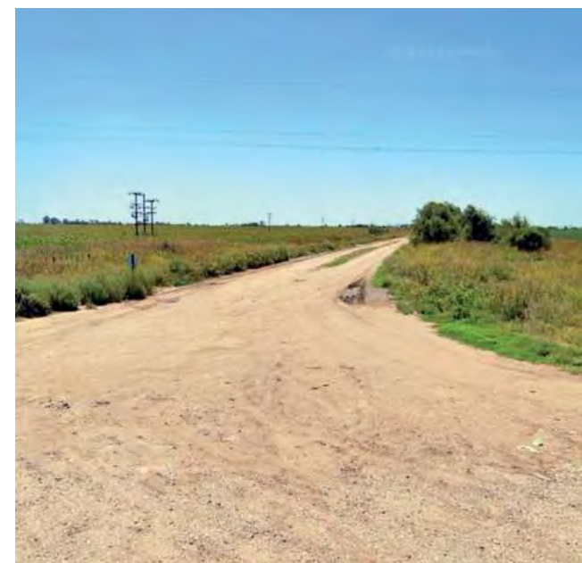
Estado actual RP 9 en el empalme RN 188 en La Pampa.

Comerciantes, empresas de traslados, estudiantes o familias que tienen vínculo directo con la localidad cordobesa deben optar por viajar por la RN 188 desde Rancul hacia Realicó, allí doblar en dirección norte por la RN 35 hasta Huinca Renancó (Córdoba), y luego tomar la RP 26 en dirección oeste hasta Villa Huidobro. El presente proyecto prevé un recorrido de 36 km entre las localidades originales, es decir, casi un cuarto del recorrido que hacen actualmente.