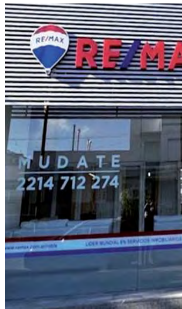
Marcas reconocidas globalmente como Century 21, Keymex Immobilier y Keller Williams, entre otras, no solo han consolidado su posición en el mercado local, sino que también han transformado las prácticas y estándares del sector.

Es clave entender que estos avances forman parte de un contexto más general. Así, este proceso de innovación no sólo es