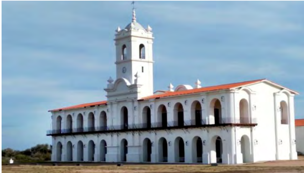
El edificio histórico del Cabildo, ubicado en CABA, fue alterado en 1894 cuando le suprimieron tres arcos del ala norte para dar paso a la Avenida de Mayo y en 1931 cuando demolieron tres más del ala sur para el trazado de la Avenida Julio A. Roca. El Cabildo completo solo puede apreciarse en una réplica a escala realizada en la moderna ciudad de La Punta ubicada en la provincia de San Luis, a 20 km de la capital puntana.

En este 25 de mayo de 2024, a pedido de algunos lectores, repetimos la reseña de los acontecimientos de aquella gesta día por día, por la cual hoy conmemoramos el "214º Aniversario de la Revolución de Mayo de 1810", antesala de un proceso que llevó a nuestro País a lograr su independencia, seis años después. De ahí su importancia. Fue el inicio de un cambio trascendental, que nos marcó hasta el día de hoy. Remontándonos a la época histórica de las invasiones inglesas y de la respectiva victoria de las tropas criollas ante éstas, un sentimiento de unidad y fuerza emergió entre la población rioplatense.