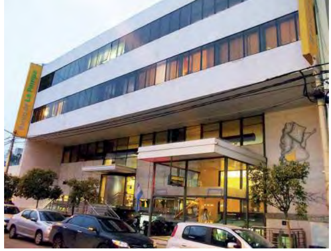
Casa Central sobre calle Pellegrini en Santa Rosa.

El Banco de La Pampa celebra en este mes de mayo, 65 años desde la primera vez que abrió sus puertas al público, en el año 1959, aunque su creación data de 1954, cuando se originó por una Ley Provincial como Sociedad de Economía Mix-