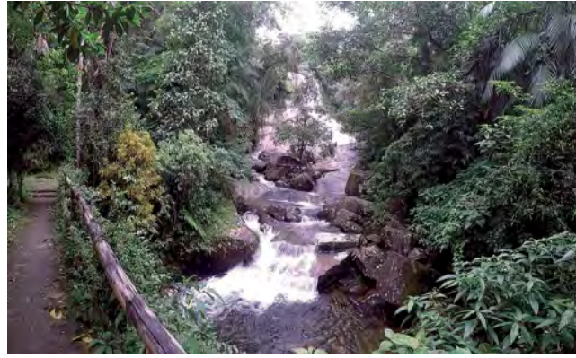
El viaje en auto transita por varias cascadas, la "Cachoeira da Escada" en Ubatuba, es una de las más hermosas.

La calle 25 de marzo recibe 400 mil personas al día, una