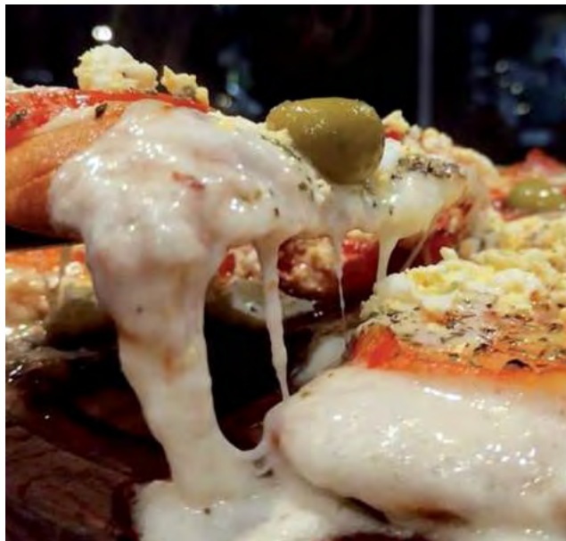
La carta de "Nova Pizza" abarca una inmensa variedad de pizzas -unas 30 opciones-.

El establecimiento gastronómico "Nova Pizza" en Santa Rosa, cumple 20 años, desde su apertura el 15 de mayo de 2004.