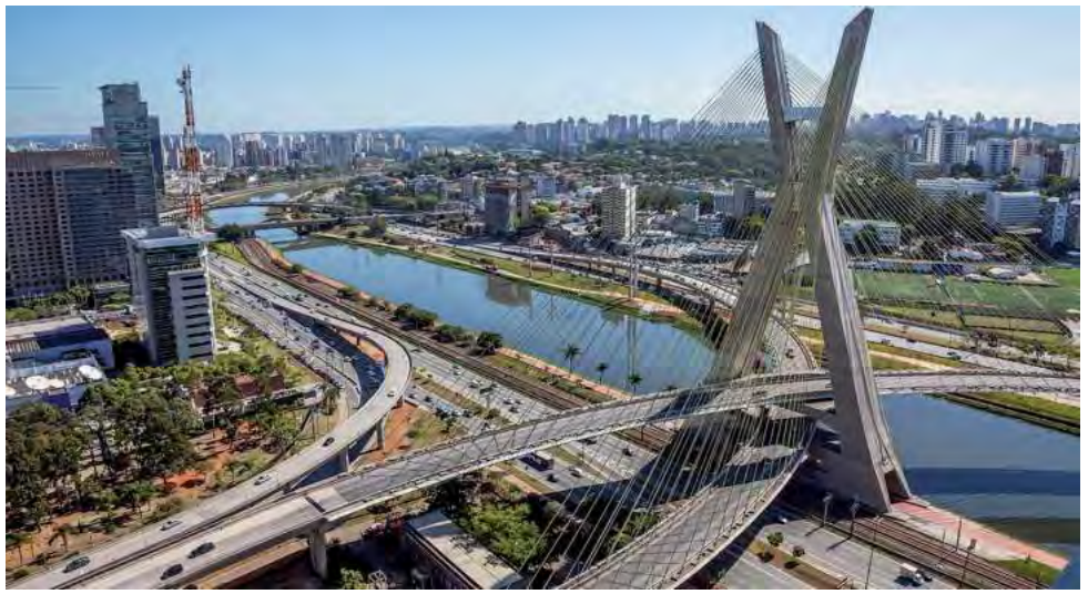
San Pablo, tiene 11 millones de habitantes y es la sexta ciudad más poblada del mundo, sólo superada por Shanghai (China), Mumbai (India), Karachi (Pakistán), Delhi (India) y Estambul (Turquía). Cuenta con 15.000 bares, más que Londres y París.

Durante todo el año la temperatura promedio es de 25 grados, elevándose a más de 30 en el verano. Es un pulmón verde de vegetación densa, con morros exuberantes que esconden más de 40 playas, 300 cascadas, ríos y senderos inhóspitos. De acuerdo a nuestra experiencia, la sugerencia es volar a Sao Paulo (San Pablo),