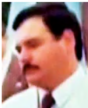
Prof. Héctor Fernando Fontaine (archivo)

La celebración se completó el pasado domingo 5 con el Almuerzo del Cincuentenario, en el gimnasio deportivo del club Ferro de Alvear, donde hubo shows artísticos como cierre.