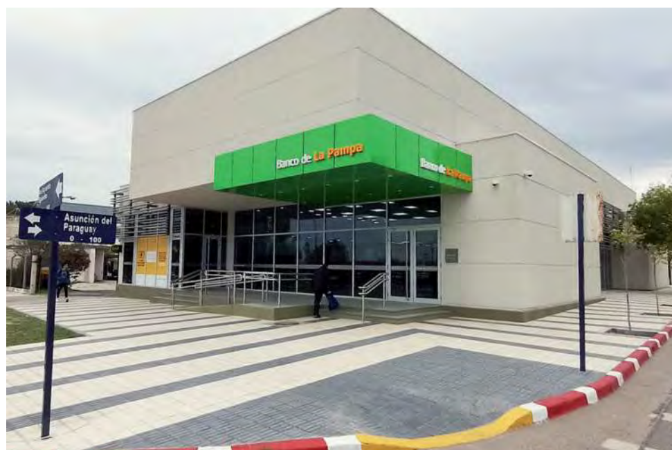
En marzo de 2022 el Banco de La Pampa inauguró un importante edificio como centro de atención en la capital pampeana, la Sucursal Norte, de Av. Spinetto y Asunción del Paraguay. Ahora está pendiente la inauguración de la nueva Sucursal Sur, que estará ubicada sobre Av. Circunvalación Santiago Marzo Sur, casi Ruta 35.

1990: A mediados de esta década adquirió el Banco de Coronel Dorrego y Trenque Lauquen SA lo que le permitió extender su área de influencia con 23 nuevas sucursales distribuidas entre provincia de Buenos Aires, Córdoba, Rio Negro