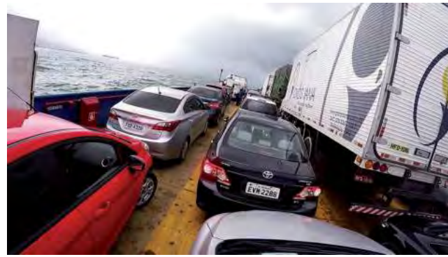
En Sao Sebastiao nos espera el cruce en ferry con nuestro vehículo hasta Ilhabela -está activo las 24 horas-.

Son menos de 200 km, pero le llevará unas cuatro horas de viaje, dado que camino a la costa la ruta se presenta