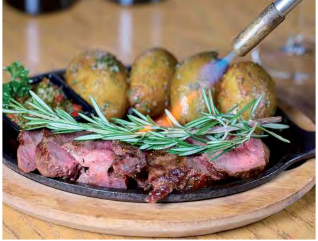
Uno de los aspectos más destacados de la escena gastronómica actual en Miami y la Florida es la creciente popularidad de la carne argentina.

En los últimos años, Miami y el sur de la Florida experimentaron una verdadera revolución gastronómica, impulsada por una amalgama de influencias culturales y cambios en los hábitos de