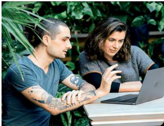
La IA está transformando no solo números en pantallas, sino también la forma en que vivimos y trabajamos.

La automatización, otro regalo de la IA, libera de las tareas tediosas para que la persona se pueda centrar en lo que realmente importa: la creatividad y la innovación.