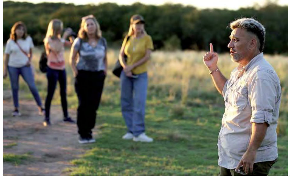
Los avistajes se realizan de día y de noche, a razón de $ 6.500 por persona. Lamentablemente, el Castillo permanece aún cerrado desde hace tiempo.

Los avistajes se realizan de día y de noche, en dos horarios, uno a las 05:30 hs y otro a las 17:30 hs. Con luz natural se observa el comportamiento de las manadas mientras pasean su porte y cornamentas imponentes.