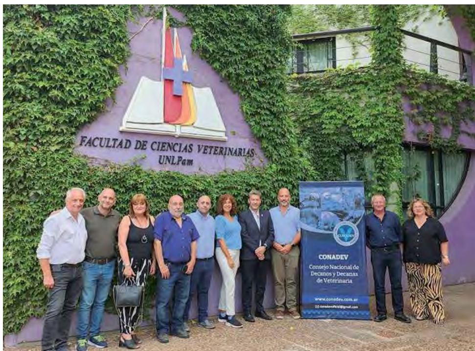
La vigilia en la FCV comienza el sábado 23 a las 19 horas, con la entrega de legajos reparados a la comunidad académica de la UNLPam víctima de la dictadura. (Foto archivo UNLPam: 71ª Reunión Ordinaria del Consejo Nacional de Decanos y Decanas de Veterinaria (CONADEV) de Universidades Nacionales)

Con la convicción de que la construcción de la memoria es un proceso colectivo, participan en la vigilia programas institucionales de la Universidad, organismos de gobierno, cooperativas, escuelas secundarias, productoras independientes, artistas e instituciones y