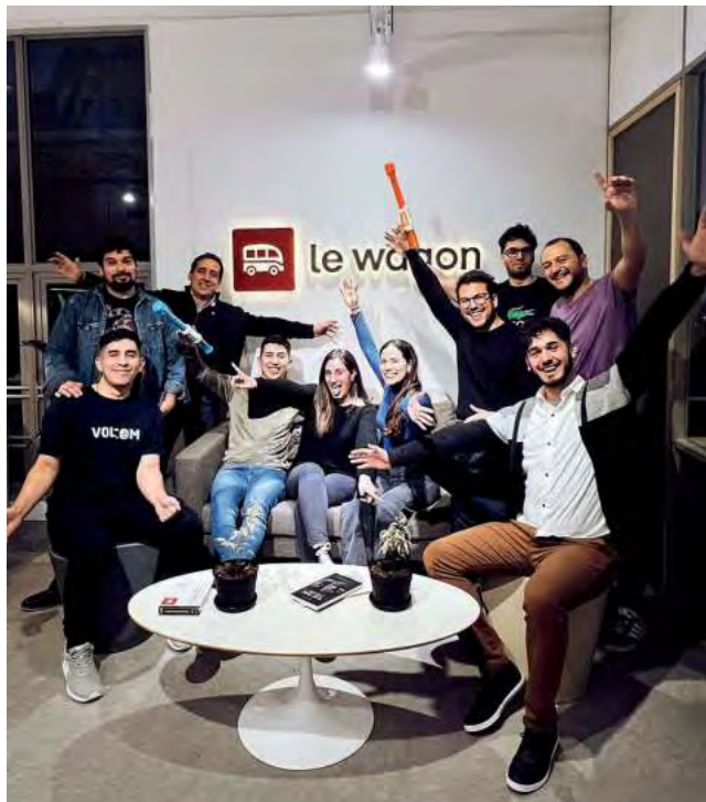
En la encrucijada entre la tecnología y la innovación, la unión de la Inteligencia Artificial (IA) y la Ciencia de Datos está escribiendo un nuevo capítulo en la historia del conocimiento.

"La IA está transformando no solo números en panta-