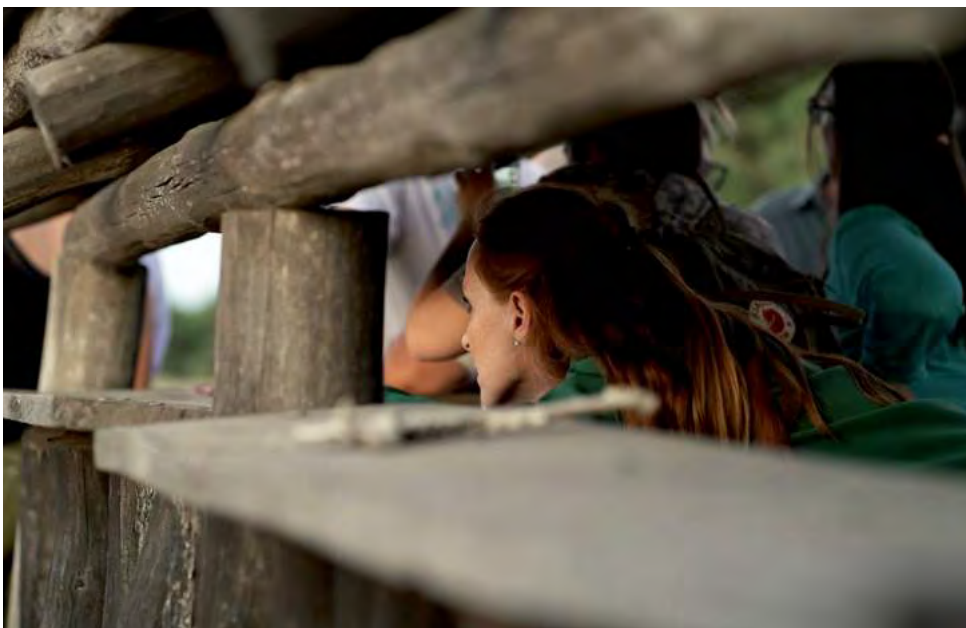
Los visitantes deben observar a los animales desde una distancia prudencial, sin que ellos noten la presencia humana, avanzando con un guía por los senderos hasta llegar a los miradores de bajo impacto ambiental, ya que están acondicionados con maderas y usan elevaciones naturales del terreno.

Durante la brama, los machos cuidan el harén y rechazan a otros machos con bramidos y peleas, mientras marcan el territorio en el bosque dejando marcas en los árboles con la cornamenta y secretando una sustancia particular.