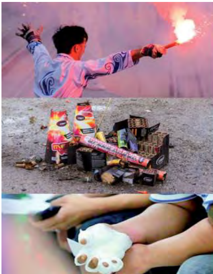
Cada año, cientos de personas resultan heridas debido al mal uso de artefactos pirotécnicos, poniendo en riesgo la vida de quienes los manipulan y de aquellos que los rodean.

Si bien existen cada año nuevas campañas de concientización sobre el uso de pirotecnia, es sumamente importante desalentar su uso y evitar así quemaduras y lesiones graves, ya que desafortunadamente causan cientos de lesiones prevenibles a quienes los manipulan y a los que los rodean, además de causar pérdidas económicas y medioambientales.