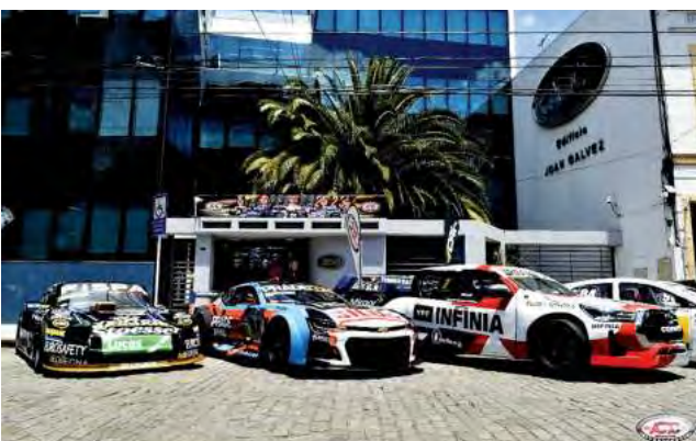
La presentación en la sede de la ACTC fue en un evento multitudinario.

Con la presencia de las autoridades de la ACTC, el Turismo Nacional y el Turismo Pista, en la histórica sede de la calle Bogotá, se presentaron los calendarios 2024 de las competencias de cada categoría que fiscalizará la ACTC. Fue un día histórico para la institución pues, más allá del anuncio del calendario del TC, TC Pista,