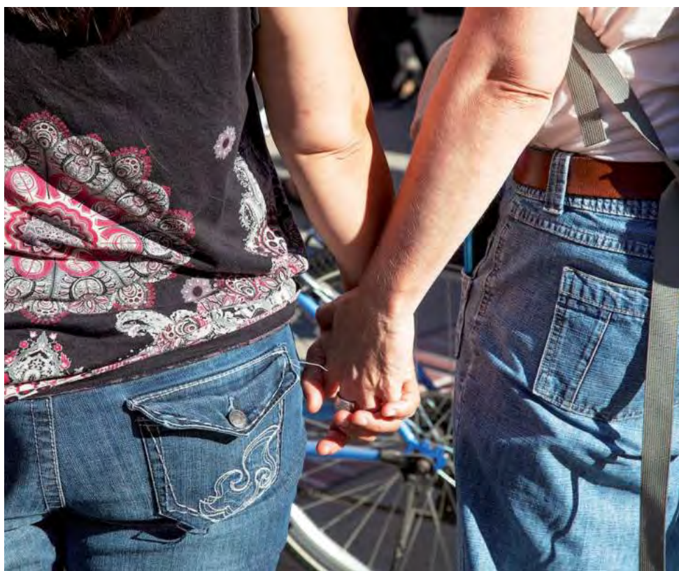
La investigación más extensa de Booking.com sobre el turismo LGBTQ+ hasta la fecha, muestra las crecientes preocupaciones en torno a sus incomodidades y cómo el apoyo activo de la industria del turismo contribuye a incrementar la confianza de las personas.

-Un 14% se siente incómoda cuando salen de noche.