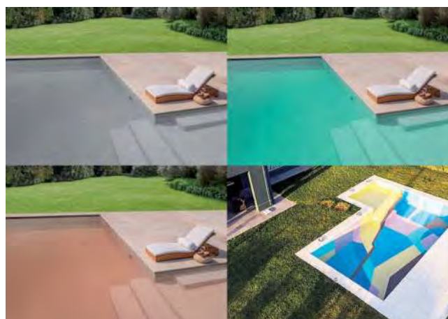
Otras variantes de colores de Sinteplast: 1) Submarino; 2) Pacifico; 3) Coralino; 4) Paleta de colores varios.

Reflectividad: el celeste tiene la propiedad de reflejar la luz solar, lo que ayuda a mantener la temperatura del agua más baja en comparación con otros colores más oscuros. Esto es especialmente beneficioso en climas cálidos, ya que ayuda a mantener el agua más fresca y reduce su evaporación.