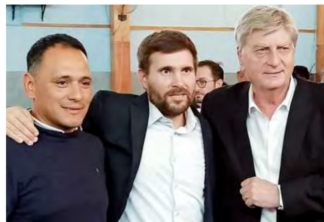
El Intendente local Elías Colado, junto al ministro de Conectividad y Modernización, Antonio Curciarello y el gobernador Sergio Ziliotto, en el acto de Santa Isabel, cuando el equipo del ENACOM anunció la inversión para ampliar en 400 km la red troncal de fibra óptica, que aportará más conectividad para La Reforma.

-21:30 hs. Peña y Baile con las actuaciones de "Campedrinos", Serena Gamboa,