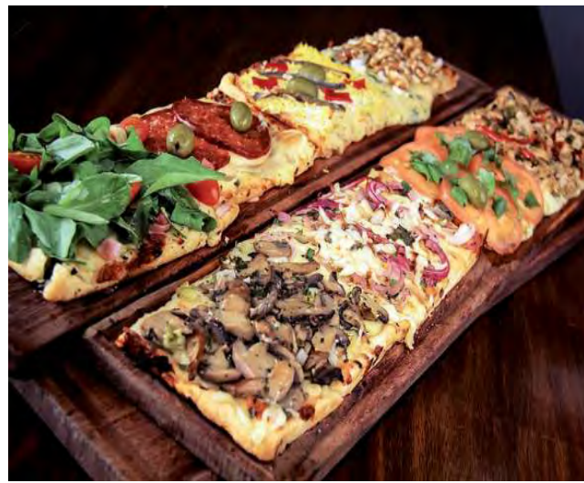
Las pizzas cuadradas y las exclusivas tablas de mix de 4 sabores bien caseros los distinguió rápidamente

Las pizzas cuadradas y las exclusivas tablas de mix de 4 sabores bien caseros los distinguió rápidamente y fueron dando la impronta a este emprendimiento familiar para, en el año 2015, unificar sus dos locales en el actual de Avenida Luro 1.451, entre Andrada y Ávila, ya impuesto su nombre de "Pizza Club",