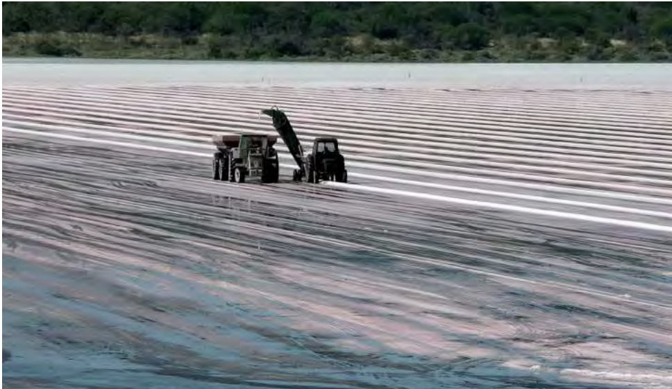
Desde hace tiempo especialistas del Departamento de Geología de la UNLPam llevan adelante una investigación centrada en valorar la presencia de cloruro de sodio, potasio, magnesio y especialmente, litio, en salinas y salitrales pampeanos.

notoriedad en el tema minería, es evaluar el potencial de la presencia de litio que tendría la Provincia, lo cual es materia de investigación