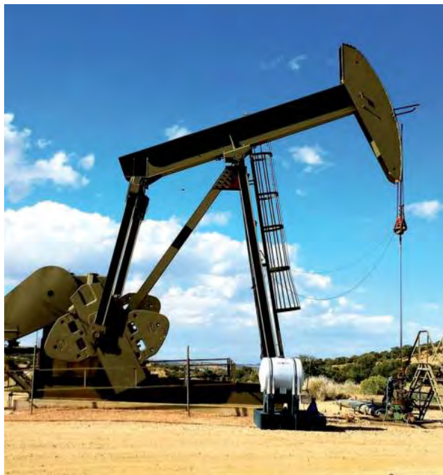
La zona hidrocarburífera en la provincia de La Pampa es el área próxima a las localidades de 25 de Mayo y Colonia Chica, donde se encuentran ubicados varios yacimientos.

Los indígenas ya consumían sal pampeana, cuando en 1668 los españoles descubrieron el gran yacimiento de Macachín, año que marca un hito en la historia de la sal en la Provincia ya que blancos e indios amigos compartieron las "Salinas Grandes de Hidalgo". Hasta ese momento la sal se transportaba en barco desde España y era destinada para conservar carnes permitiendo el mantenimiento de las colonias de esclavos. Su función decisiva era como conservadora de cueros. El cuero era un elemento de un valor increíble. Pero su valioso papel en la vida del hombre fue el hecho de haber sido utilizada como moneda en las civilizaciones antiguas y que de ella derive la palabra "salario", porque era con sal que se pagaba