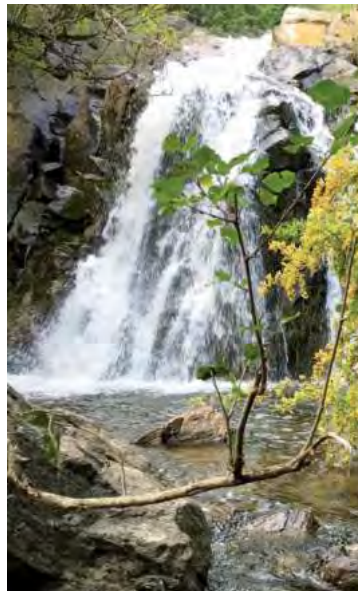
Santa Rosa de Calamuchita: idyllic beaches and balnearios, or a través

Alta Gracia es uno de los destinos turísticos más próximos a