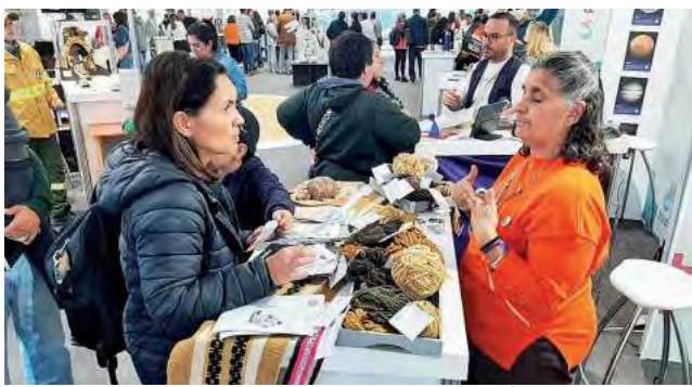
Stand de "Turismo Algarrobo del Águila"