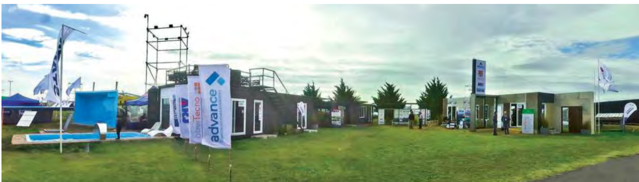
Uno de los mejores stands de la ExpoPyMEs 2023 fue el logrado en conjunto por las empresas pampeanas "Abertecno", "Advance", "Pastorutti NeoRed" y "Aberturas Ricardo Juan".