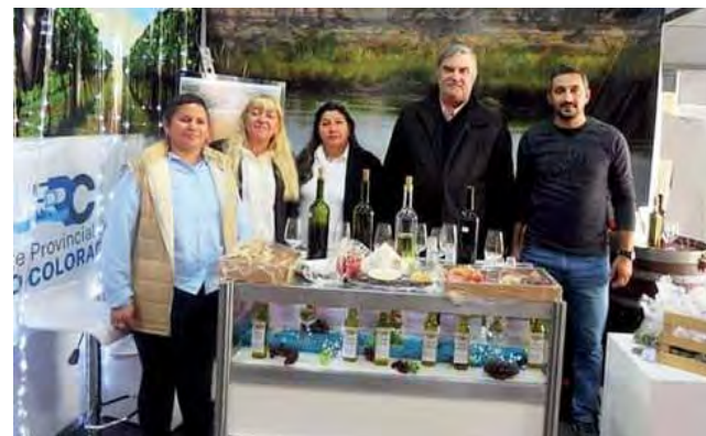
Stand del "Ente Provincial del Río Colorado"