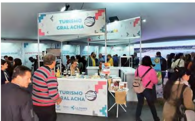
Stand de "Turismo General Acha"