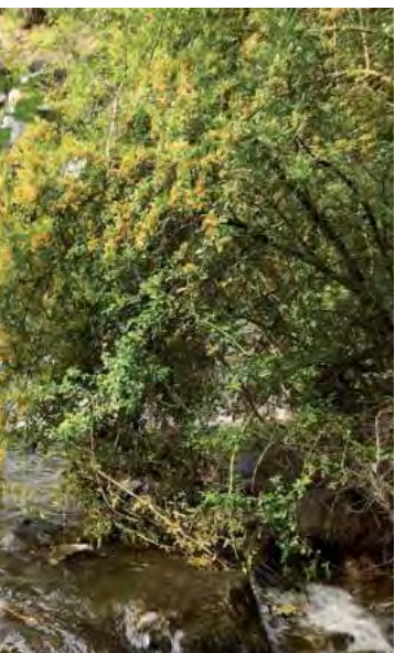
Es ideal para desconectarse en sus caminatas por sus circuitos.

Hoy, esta antigua cantera de piedra se ha convertido en un hermoso espejo de agua rodeado de naturaleza.