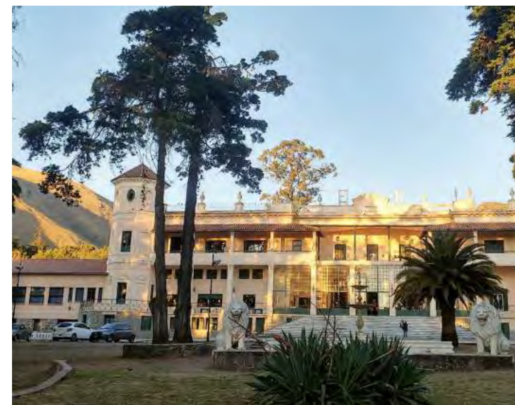
Si de encantos coloniales, hermosas vistas y actividades hablamos, La Falda no puede quedar afuera de la lista.

Entre los espacios culturales también destacan la emblemática Estancia Alta Gracia. Construido en 1643, está integrado por la iglesia, que destaca por su fachada sin torres. A ésta se le suma una residencia donde funciona, desde 1977, el Museo Nacional Estancia Jesuítica de Alta Gracia y Casa del Virrey Liniers. En su interior, se resguarda una importante colección de objetos de los siglos XVII, XVIII y XIX.