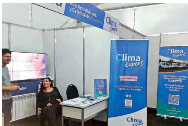
Stand de la empresa "HBKlima"