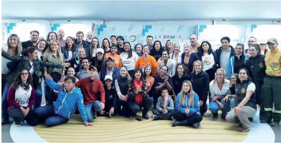
Personal de la Reserva Parque Luro y de la Secretaría de Turismo acompañó con presencia permanente, material informativo y souvenirs, a prestadores y municipios.

En la carpa de Turismo, las oficinas de turismo municipales y los prestadores de diversos servicios atendieron consultas del público y establecieron contactos comerciales durante las tres jornadas. Personal de la Reserva Parque Luro y de la Secretaría de Turismo acompañó con presencia permanente, material informativo y souvenirs, a prestadores y municipios por su participación: La Luna Pesca y Camping, Lestrade Rent a Car, las áreas de turismo de