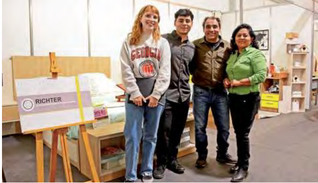
Stand de "Richter, Carpintería y Diseño"