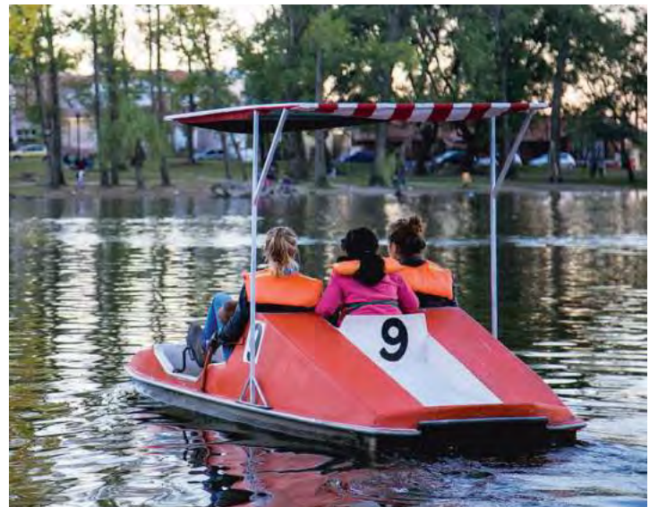
Alta Gracia, localizada en el Valle de Paravachasca, es una localidad rica en historia, cultura y paisajes naturales.

Esta gran obra de ingeniería, creada en 1659 por los padres jesuitas, fue declarada Patrimonio de la Humanidad por la UNESCO. Su construcción tuvo como objetivo facilitar el riego de las huertas en la zona y el funcionamiento de dos molinos hidráulicos harineros y el batán.