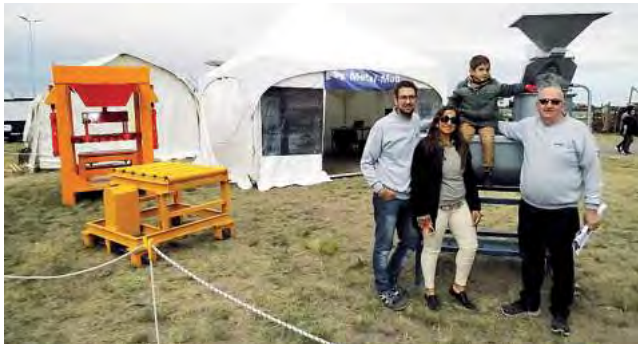
Stand de la empresa "Metal Maq"