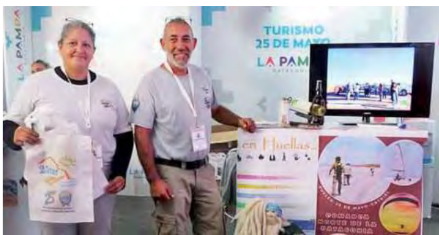
Stand de "Turismo 25 de Mayo"