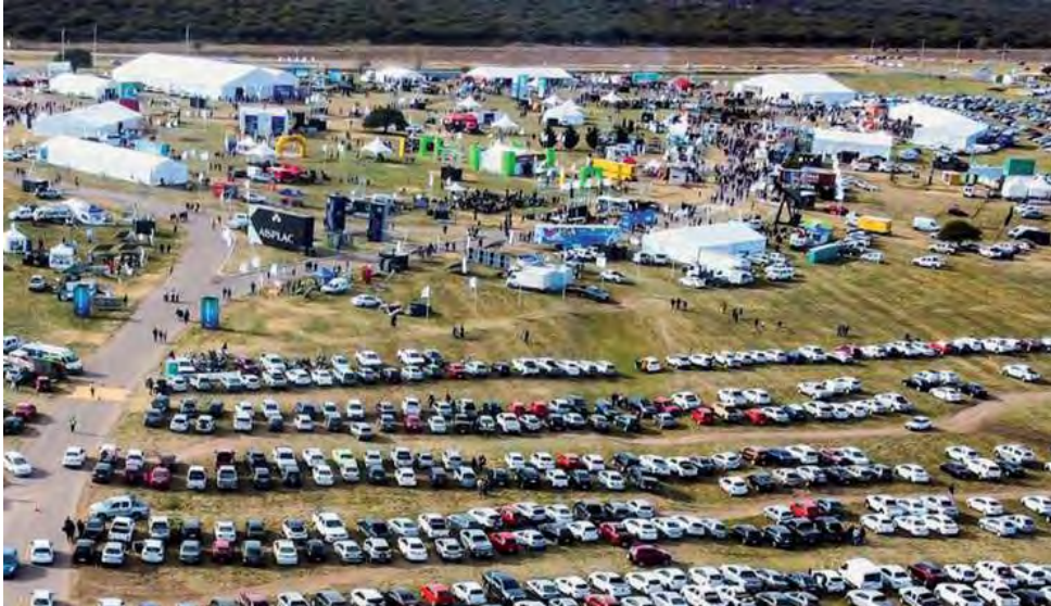
Es una edición con grandes novedades y récord de participación de empresas. Habría más de 420 stands y 25 puestos de gastronomía. Viernes y sábado Rondas de Negocios.

El evento organizado por el Gobierno de La Pampa a través del Ministerio de la Producción y el Consejo Federal de Inversiones, junto al Fideicomiso del Autódromo de La Pampa, la Municipalidad de Toay, ICOMEX y Banco de La