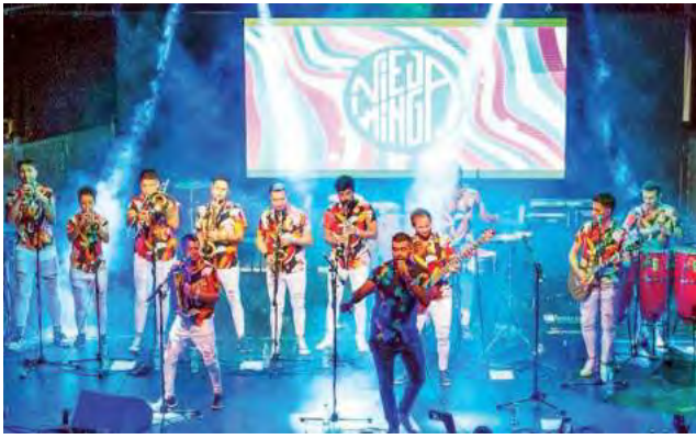
El sábado 15 Anchorena festeja con Cena Aniversario y Baile popular con show en vivo, a cargo del exitoso grupo de cumbia latinoamericana "Vieja Minga".

La localidad pampeana de Tomás Manuel de Anchorena, nació en 1910 con la creación de la Estación del Ferrocarril. En ese tiempo la Provincia atravesaba de pleno la etapa de colonización. Fueron muchas las fundaciones realizadas, varias de ellas precisamente ese año. La piedra fundamental de Anchorena se fijó en los terrenos de la línea ferroviaria, el 14 de abril de 1910.