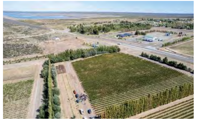
El turismo y la producción no son una quimera en Casa de Piedra, son una realidad tangible que requiere de más y mejor infraestructura para su desarrollo.

La Villa turística y productiva Casa de Piedra será otras de las localidades que se verán impactadas positivamente por los trabajos de reparación que se realizarán sobre la ruta nacional 152 licitada al cierre de esta edición.