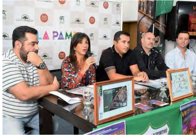
El Campeonato Sudamericano de Atletismo Master Ruta regresa al país después de 12 años y la capital pampeana será escenario de la disputa.

El Gobierno provincial, a través de la Secretaría de Turismo, presentó la 7ª edición del Campeonato Sudamericano de Atletismo Master Ruta 2023, que se realizará del 26 al 28 de mayo en Santa Rosa y que después de 12 años vuelve a la Argentina.