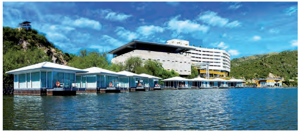
En Potrero de los Funes, San Luis y alrededores, podemos encontrarnos con hoteles de primera categoría, como también confortables cabañas cercanas al lago.

Si le gusta hasta aquí el viaje, ahora viene un nuevo tramo (algo más de 260 km) hasta la ciudad de San Luis, provincia en la cual las rutas se distinguen por su buen estado y la abundancia de autopistas. La capital puntana es ideal para sentar base, ya sea en muy buenos hoteles del centro, como en la gran oferta cercana de alojamiento en torno al lago Potrero de Los Funes, hasta el cual hay que llegar en un recorrido