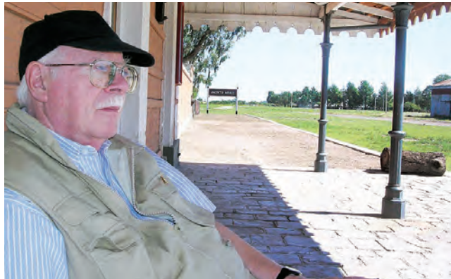
Foto de su última visita a La Pampa.

El director fundador de la Agencia Periodística Cid y del Diario del Viajero, se fue a dormir eternamente el pasado domingo 25 de septiembre, a los 93 años.