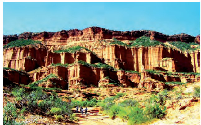
Parque Nacional Sierra de las Quijadas, San Luis.

Ni hablar que la zona es la más rica en cuanto a turismo rural y en testimonios de historia pampeana, con estancias turísticas muy destacadas, que es necesario reservar previamente.