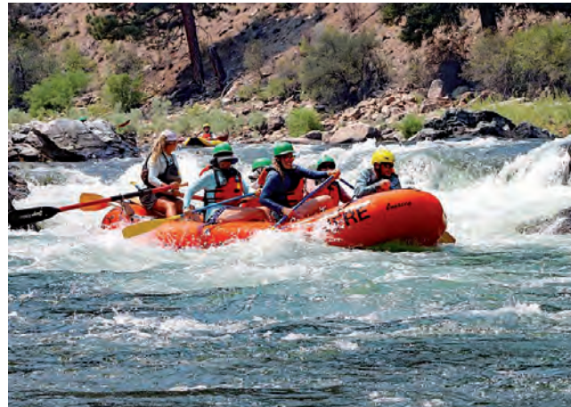
San Rafael: Rafting en el río Atuel.

No le vamos a decir todo lo que usted puede hacer en La Pampa, porque ya lo sabe.