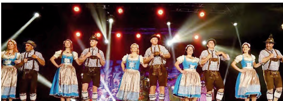
Grupo Tírol de Villa General Belgrano, Córdoba, permanentes animadores de la fiesta.