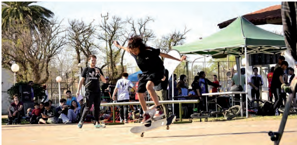
La celebración del "Mes de las Juventudes" en Santa Rosa se inició el sábado 3 con un festival de cultura urbana con variadas actividades en el Prado Español

-Sábado 10: desde las 16 hasta las 20 hs. en el paseo ferial situado sobre calle Alvear entre Avellaneda y Coronel Gil, novedosa Feria Expo-Joven, con más de 60 puestos donde jóvenes emprendedores, artesanos y manualistas brindarán una variada cantidad de produc-