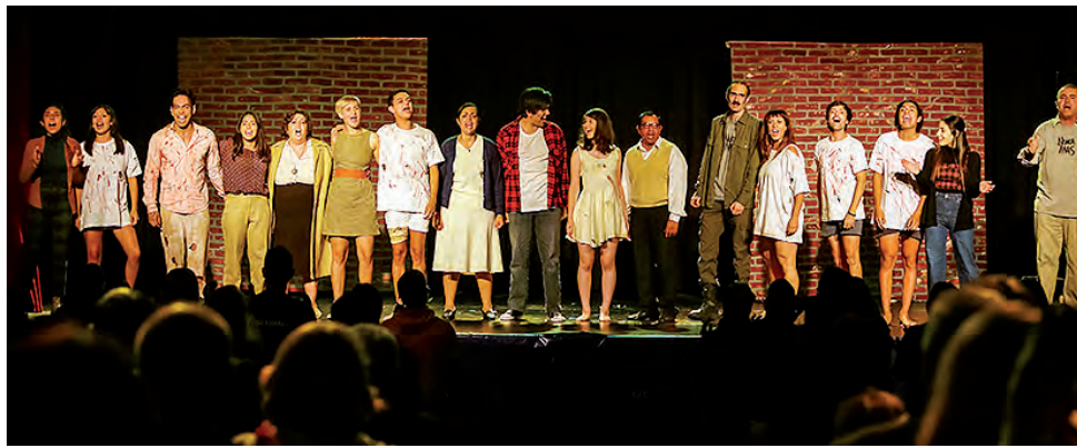
El jueves 15 y viernes 16, a las 15 y a las 10 hs. respectivamente, se llevarán a cabo funciones de la obra de teatro musical "Lápices", en el Teatro Español.