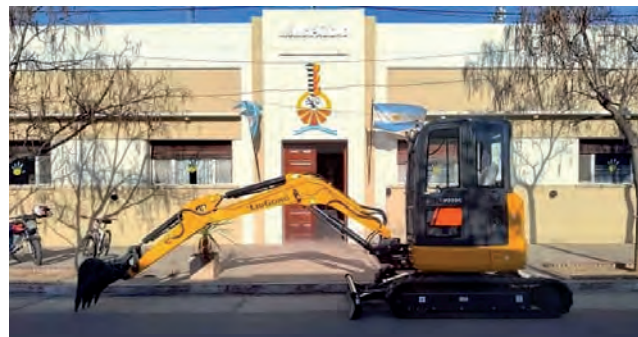
Miniexcavadora marca LuiGong modelo 9035Ezts, adquirida recientemente por el Municipio para reforzar el parque automotor de la Comuna.