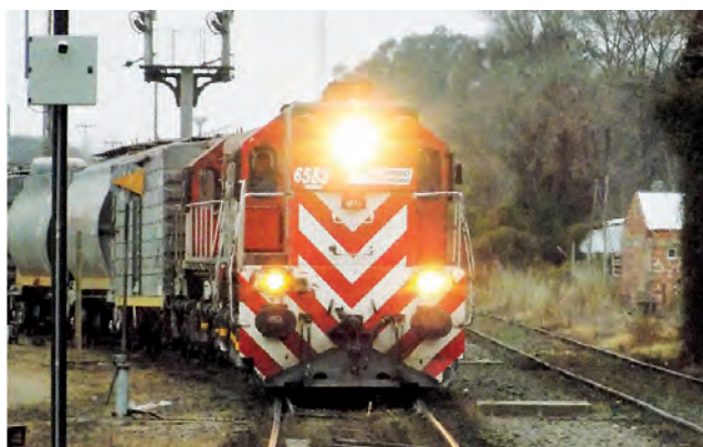
Catriló es el centro de recarga del ferrocarril, acá están los talleres y aquí se aprovisionan de combustible cuando vienen desde Rosario a Bahía Blanca o viceversa.