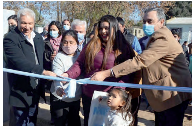
Entrega de viviendas del Plan "Mi Casa"

Por otra parte, explica Bogino, se está "componiendo La Casa de la Cultura y la Terminal de Ómnibus (hoy concesionada y en funcionamiento junto al hotel), también está en proceso de reacondicionamiento el Jardín Burbujitas, con la idea de ampliar y hacer un