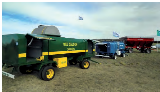
Stand de Implementos Agrícolas "El Caldén"

Entrevistas completas en: www.region.com.ar