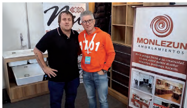
Stand de "Monlezun Amoblamientos"