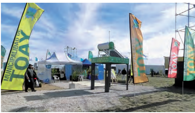
Estación Solar que expuso la Municipalidad de Toay