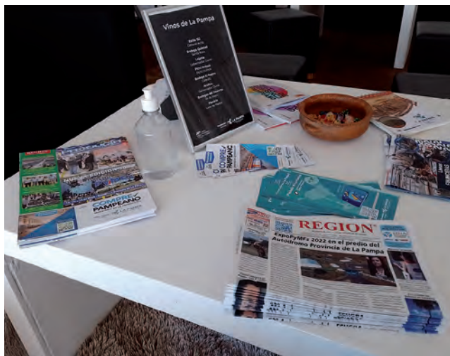
REGION® Empresa Periodística estuvo presente en distintos puntos de la Expo promocionando sus productos.

Entre otros conceptos agregó: "Diseñamos un programa de fortalecimiento al sector emprendedor, donde pondremos a disposición de las y los emprendedores, créditos de hasta $ 750.000 a 60 meses de plazo. Para esta operatoria el CFI subsidia la tasa de manera que el emprendedor en ningún caso tenga que afrontar un costo mayor al 15% anual".