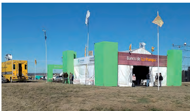
Stand institucional del "Banco de La Pampa"