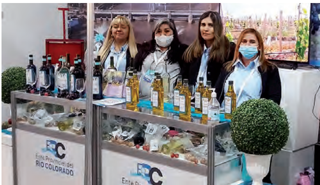
Stand del "Ente Provincial del Río Colorado"