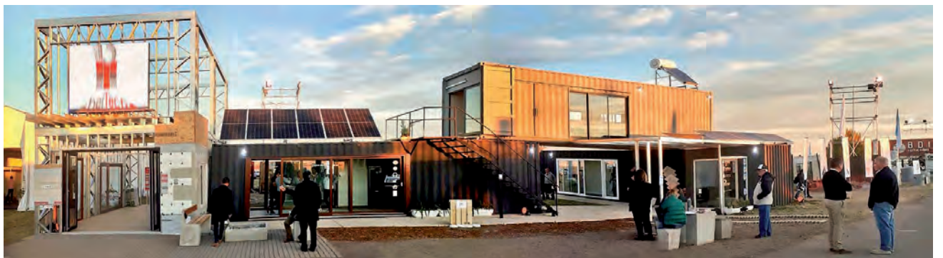
Atractivo stand de las empresas "Advance" y "abertecno", uno de los más visitados durante la ExpoPyMEs