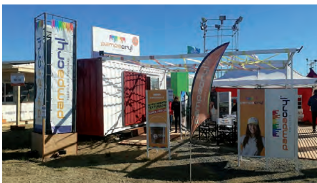
Stand de "Pampacryl"