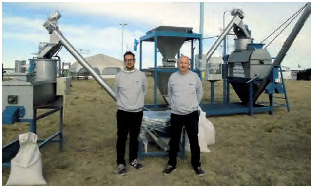
Stand de "Metalúrgica Metal - Maq"

Tenemos el sector de mecanizado y el de armado donde