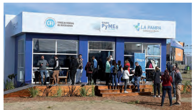
Stand de la Organización de ExpoPyMEs 2022