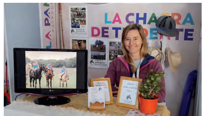
Stand de "La Chacra de Tridente" en la carpa Turismo