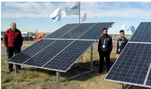
Stand de "INSAER, Sistemas de Energías Renovables"

Desde General Pico y para toda La Pampa estamos integrando toda la gama de productos tanto lo que es fuentes de energía solar como eólica, incorporándole la tecnología que tenemos hoy vigente tanto para sistemas autónomos de energía como para poder cubrir la demanda o hacer ahorros de energía en la modalidad de inyección a red que es lo que establece hoy la nueva Ley de promoción que lleva adelante el gobierno de la