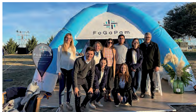
Stand de "FoGaPam"