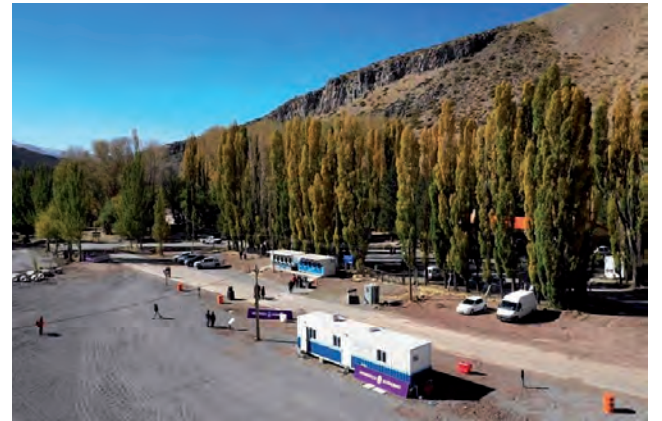
VIENE DE TAPA

Con la mira puesta en habilitar el transporte de todo tipo de vehículos a través del Paso Pehuenche, en el Sur provincial, para convertirlo en un paso alternativo y complementario al Cristo Redentor, funcionarios de dependencias nacionales, provinciales y chilenas mantuvieron productivas reuniones en las que se avanzó en la necesidad de unificar el sistema migratorio entre ambos países.