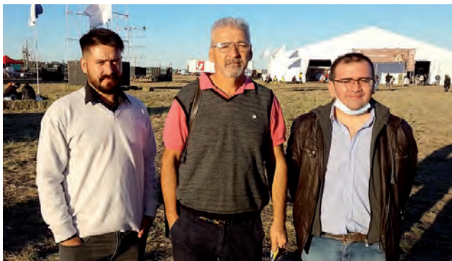
25 de Mayo presente en la Expo con sus autoridades