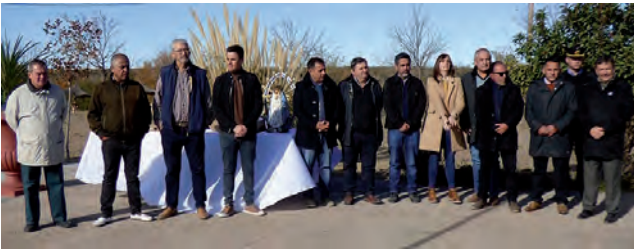
VIENE DE TAPA

Como parte de los actos se entregaron distinciones a viejos pobladores, personal de salud y crianceros como homenaje en este nuevo aniversario. Luego hubo un almuerzo de camaradería para continuar por la tarde con la jineteada, las destrezas criollas y baile popular.