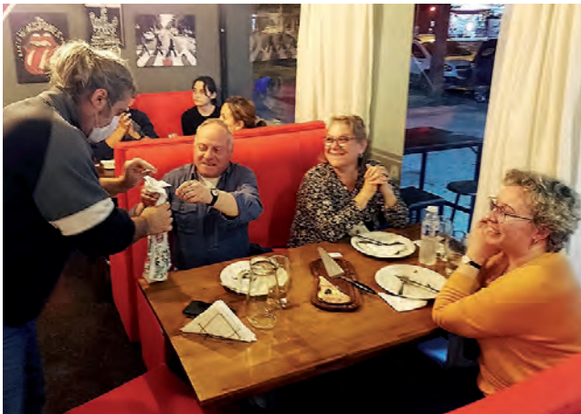
Las noches de "Pizza Club" se ven amenizadas muchas veces por juegos y sorteos sorpresas para los clientes.

(con carne ahumada y salsa picante) entre otras.