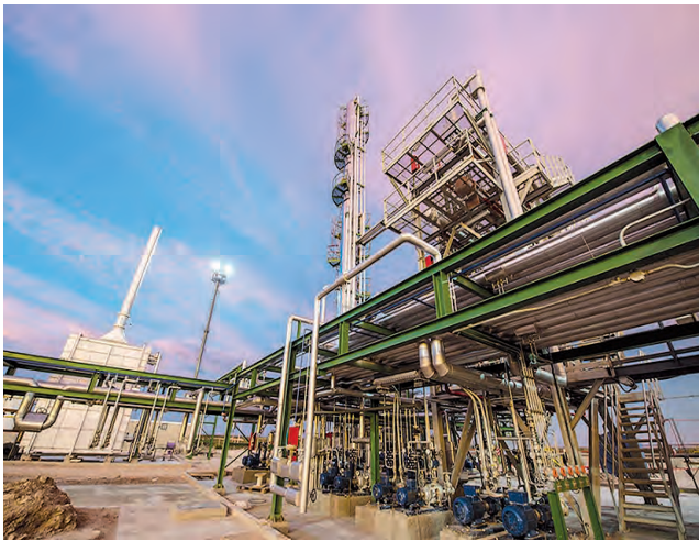
La Pampa hoy ya es una provincia hidrocarbúfera importante con reservas de gas y petróleo aún inexploradas.

Otras salinas importantes, explotadas comercialmente, son el "Salitral Negro" cerca de la localidad de La Adela, en el Sur Provincial.