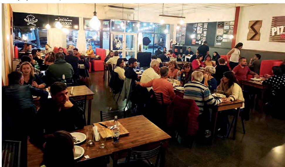
"Pizza Club" en su actual local de Avenida Luro 1.451, entre Andrada y Ávila, deleitan a los paladares más exigentes con exquisiteces exclusivas e innovadoras.

tradicionales embotelladas, últimamente incorporaron la conocida cerveza tirada India Bonita de gran aceptación entre el público.