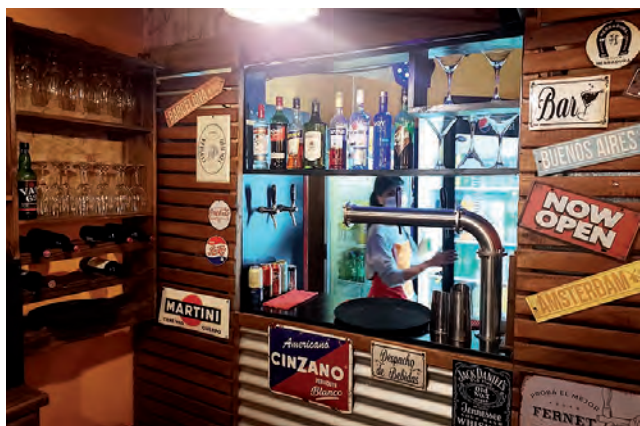
La nueva barra cervecera conquista a todos, en especial con la nueva cerveza tirada India Bonita.