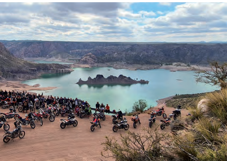
Adventure Rally Raid "Los Andes", en el Cañón del Atuel, Mendoza.