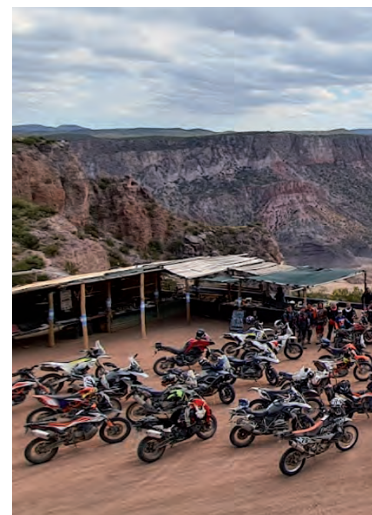
Edición anterior del Adventure Rally Raid

En un evento exclusivo al que asistieron participantes de ediciones anteriores, miembros de la prensa e invitados especiales, se llevó a cabo la presentación de la tercera edición del Adventure Rally Raid, denominada "Patagonia". La misma se desarrollará del 7 al 11 de noviembre, teniendo como punto de inicio a la ciudad de Viedma y tocando, entre otras, Las Grutas, Playas Doradas y San Antonio Este, una zona turística en creciente expansión.