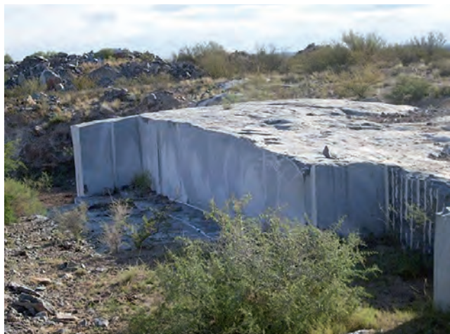
En Limay Mahuida se encuentra un importante yacimiento de mármol negro (Portoro Italiano) del tipo "Rogaciano". También Puelén tiene mármol del tipo "Marbayo" o "Marfil crema", ambos con una amplia capacidad estimada en millones de toneladas de producción, según la consignataria "Campos del Estero" que los tiene a la venta.