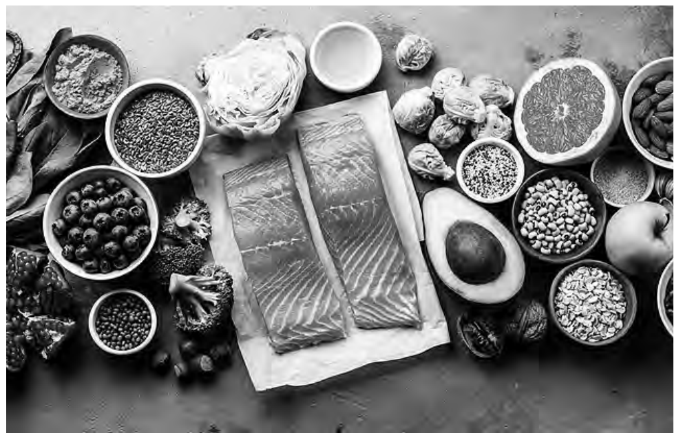
La vitamina D puede obtenerse a través de la exposición directa al sol, la correcta alimentación y los suplementos con vitamina D, que también tienen la capacidad de reducir el riesgo de infección por COVID-19 y el desarrollo de complicaciones.

Existen muchos factores que pueden causar niveles bajos de vitamina D, como es el caso de adultos mayores, vivir a altas latitudes donde los rayos del sol son más débiles, tener una piel más oscura que produce menos vitamina D al exponerse a la luz solar, la obesidad, enfermedades crónicas o