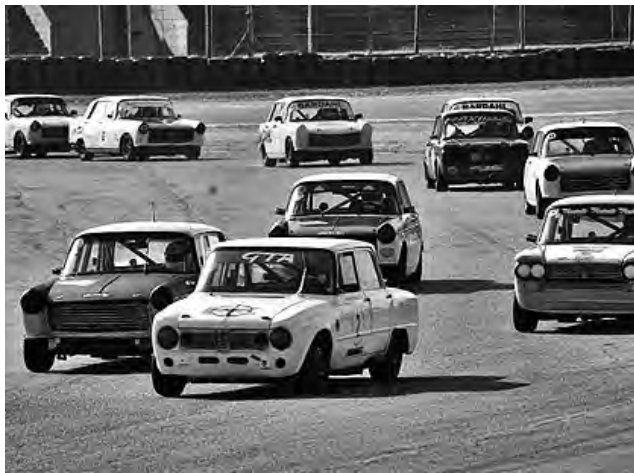
"Las 24 horas de Buenos Aires" permitirá vehículos del tipo sedán y coupé comprendidos entre 1961 y 2000 inclusive, divididos en categorías por año y cilindrada.

Compartimos la noticia y hacemos propicia la ocasión para saludar a la Asociación Argentina de Automóviles Sport que presentó la competencia de 24 horas del anexo J histórico en el Autódromo Oscar y Juan Gálvez.