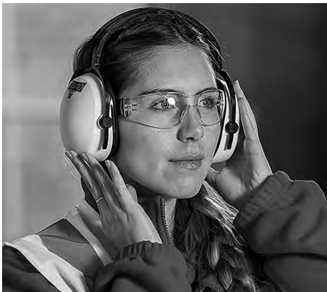
Hoy la Industria Argentina cuenta con una muy importante participación de la mujer en todos los segmentos.

El potencial regional y sectorial de Argentina conforma uno de los activos productivos más importantes de cara al futuro. Ponerlo en valor es uno de los desafíos trascendentales que los hombres y las mujeres industriales de nuestro país tienen por delante en los próximos años.