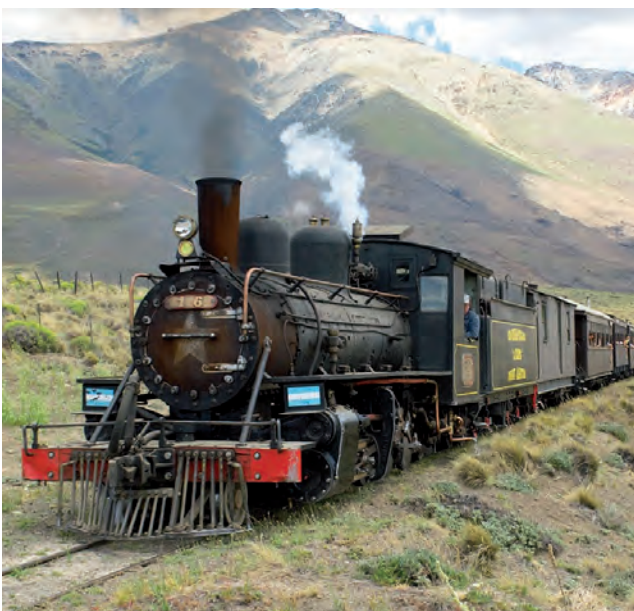
VIENE DE TAPA

ideal para este momento, ya que poseemos grandes extensiones con diferentes atractivos y actividades, donde la mayoría se disfruta en contacto directo con la naturaleza”.