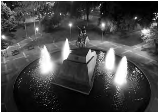
por una ley natural.

Los días simples pasaban por las calles y las casas de hace mucho en este pueblo, los muchachos no tomaban más que un vino y otro vino de modesta pretensión. La gente pobre en los barrios se preparaba a la tarde para dar la vuelta al perro frente a bares y vidrieras y entre coches bulliciosos que encendían su emoción.