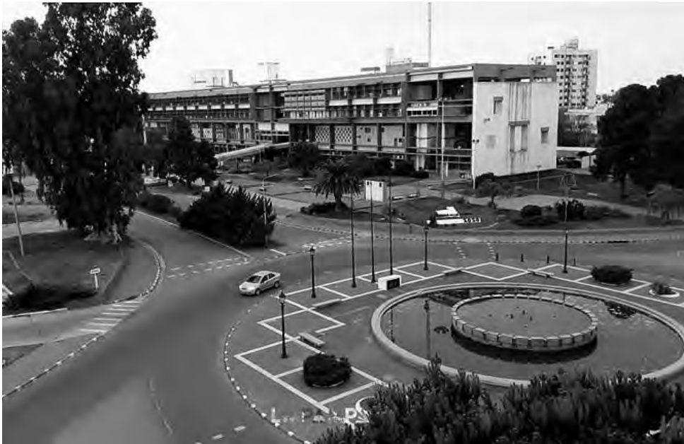
Para participar hay que inscribirse este mismo viernes 25.

En las visitas guiadas propuestas, se pondrá de relieve la arquitectura contemporánea de la capital pampeana. La actividad tendrá lugar