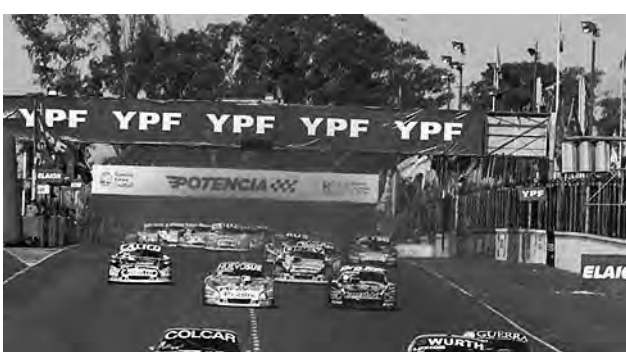
La próxima, 5ª fecha del campeonato, se llevará a cabo el fin de semana del 2, 3 y 4 de octubre en el autódromo Oscar y Juan Gálvez de Buenos Aires.

El Comité Ejecutivo de la Asociación de Corredores de Turismo Carretera (ACTC), tras el reinicio de la actividad en las pistas (ver REGION® Nº 1.418), emitió un comunicado diciendo que "Una vez más el Turismo Carretera demostró por qué es la categoría más importante y popular del automovilismo argentino al llevar adelante el reinicio de la actividad deportiva nacional, dentro de los protocolos obligados por la pandemia que azota al mundo entero".