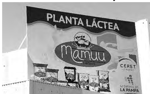
El Área Láctea del CERET es la más conocida por la elaboración de los productos pampeanos marca "Mamuu".

Por tal razón, su misión es: "Generar actividades de formación, capacitación, transferencia de tecnología, investigación aplicada y servicios