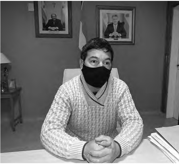
VIENE DE TAPA

El jefe comunal informó que "se ha estado hablando con el presidente del IPAV, Jorge Lezcano y la idea es construir dos viviendas del Plan Mi Casa. El año pasado habíamos pedido cuatro viviendas pero por el momento son dos", expresó.