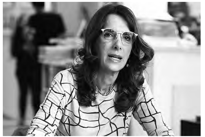
VIENE DE TAPA