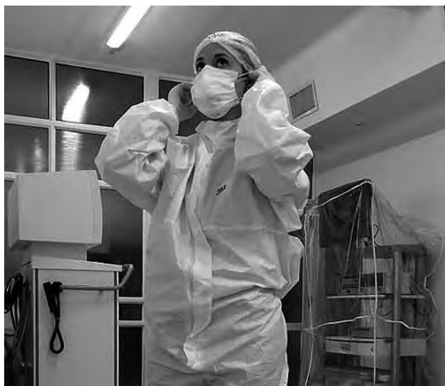
Elementos de protección personal del equipo de salud de la Clínica Argentina de General Pico, que atiende a pacientes con covid19.