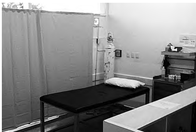
Guardia diferenciada para pacientes febriles respiratorios (ingreso por separado de la guardia general). Aquí entran los pacientes sospechosos o confirmados de covid19.

Desde la Clínica Argentina expresaron: "La salud de la Población y del personal que trabaja en la Institución son la prioridad número uno. A partir de la Declaración en la provincia de La Pampa de MAXIMA ALERTA SANITARIA, dispuesta por el decreto 521/20 donde se insta a optimizar el servicio, priorizar la prevención y anticipar las