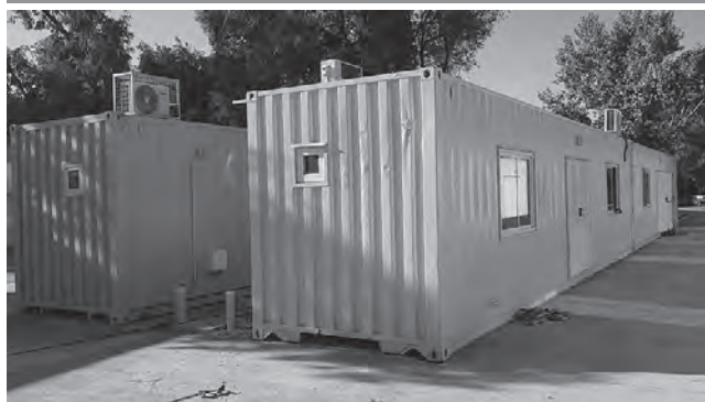
Los nuevos módulos contenedores instalados en el Hospital Gobernador Centeno de General Pico, se generaron como refuerzo y están en su fase final de terminación.

rio, con respiradores, en un todo de acuerdo a las normas nacionales e internacionales. También se implementó los nuevos módulos contenedores de Hospital, que se generaron como refuerzo y que están en su fase final de terminación. En este caso tendrán de 15 a 20 días más de trabajo pero ya están prácticamente todas las conexiones, los catorce módulos instalados, los equipos de mantenimiento, el área de máquinas completas aprobadas y en funcionamiento".