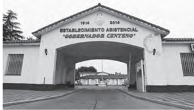
El Laboratorio de Microbiología del Hospital central de General Pico, es uno de los dos establecimientos oficiales donde son procesadas las muestras para diagnóstico de COVID-19 a través de la técnica PCR en tiempo real.