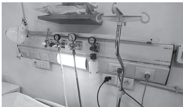
La Unidad de Terapia Intensiva se amplió de 6 camas a 14, con todo el equipamiento necesario, en un todo de acuerdo a las normas nacionales e internacionales

tal merece un párrafo aparte, porque ha hecho un aporte importantísimo a través de la comunidad de todo, desde barbijos, ecógrafos, pasando por tiempo de trabajo dedicado de personas cocinando barbijos, han hecho camisolines, mamelucos, están trabajando actualmente. Además hay gente que ha comprado cosas de un valor económico importante, como un ecógrafo, oxímetros de pulso, termómetros digitales. El trabajo que han hecho la Cooperadora y la Comunidad para con el Hospital, en realidad es muy importante. Estamos muy agradecidos, todo el personal, por el esfuerzo que ha realizado la comunidad a través de la cooperadora y otras instituciones que están trabajando con la cooperadora, asociaciones civiles, ONG's, comisiones de fomento barriales, hay mucha gente que está trabajando, como eje la Cooperadora del Hospital, pero trabajando en conjunto con todos ellos" finalizó diciendo el Dr. Esteban Vianello.