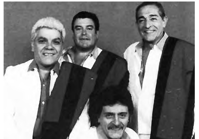
"Los de Salta" actuarán en la noche central de la Fiesta.