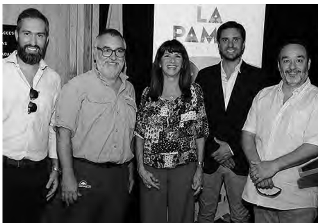
Funcionarios presentes en el MinTur de Nación.