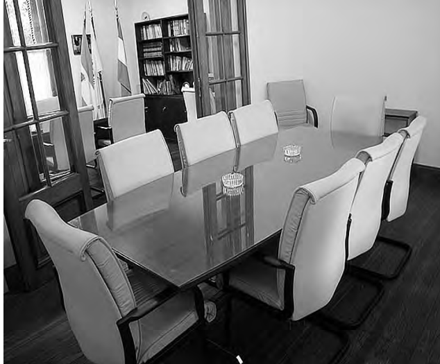
Sala de Presidencia del Colegio de Martilleros y Corredores de Comercio en su sede de Santa Rosa.