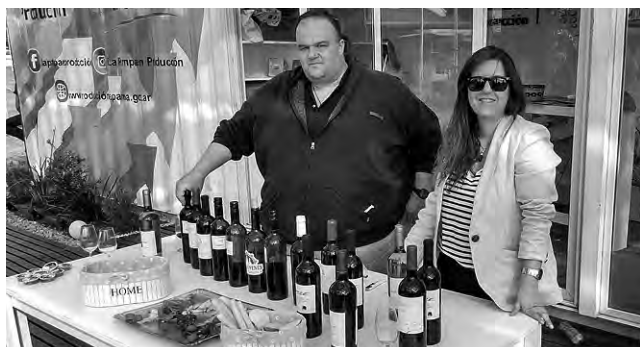
El Ente Provincial del Río Colorado estuvo presente ofreciendo degustaciones de los excelentes vinos pampeanos provenientes de la zona del Área Bajo Riego.

Una vez más se realizó en Santa Rosa, la exposición anual que organiza la Asociación Agrícola Ganadera de La Pampa, que en 2019 fue la 93ª Edición.