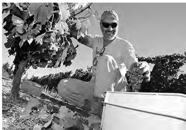
La Pampa es la 6ª productora de vinos en Argentina y este año podría llegar a ser la 5ª a nivel nacional