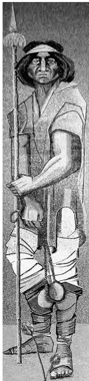
La imagen de "el indio" realizada por el escultor Abel Magnani, con el aporte del profesor universitario de artes José Domingo Laporta.

Hoy esa imagen sigue siendo un ícono de La Pampa y tal vez, su mayor capital.