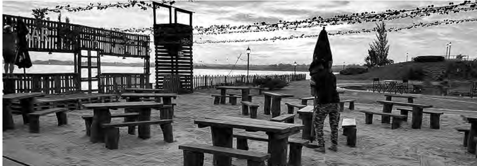
Desde el Bar de Playa de "Brücke", con arena, se disfruta como si se estuviera a orillas del mar, viendo el reflejo de la puesta del sol o las luces en el agua de la Laguna Don Tomas.