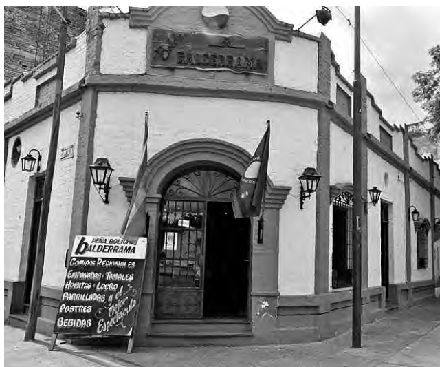
En las noches salteñas, "El Boliche Balderrama" es la cita oficial para disfrutar lo mejor del folklore y la especial gastronomía típica con un menú tan variado como exquisito.

Se mezcla la tradición, la arqueología, las montañas, los viñedos, los diques, las ruinas indígenas, el folklore, los valles, los ríos, las comidas exquisitas, con buena hotelería y un clima que engaña, de día hace calor y a la noche refresca bastante.