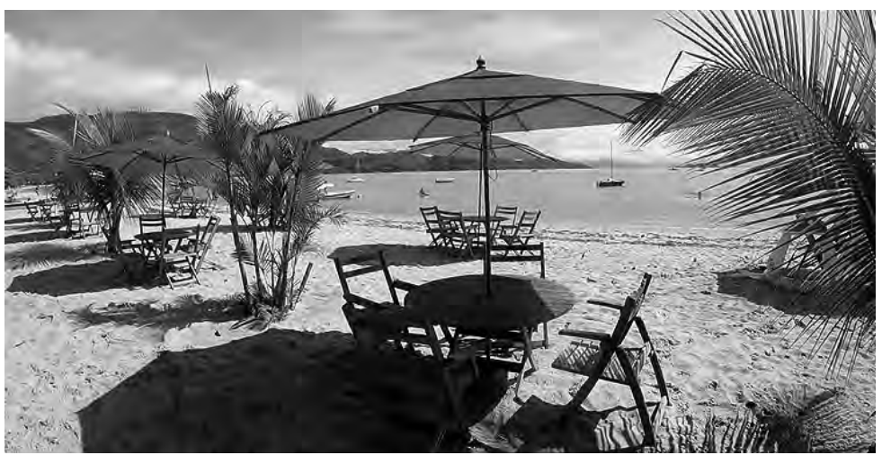
La encuesta revela que más de la mitad de los viajeros de Argentina (un 65%) dijeron que planean hacer más escapadas de fin de semana durante 2019.

Booking.com, el líder global en conectar viajeros con la variedad más amplia de alojamientos, realizó una investigación a más de 21.500 viajeros de 29 países, incluyendo Argentina, para revelar algunas predicciones de viaje para 2019 que permiten tener perfiles y estilos de viaje de los viajeros argentinos el año que viene.