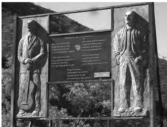
En viaje hacia Tucumán, muy cerca, está la "Cuesta del Portezuelo", immortalizada por la zamba de Polo Giménez.

-Sacarse fotos en Plaza Independencia, con el fondo de alguno de los espectaculares edificios históricos que hacen una postal única, en una provincia donde Lola Mora realizó varias esculturas, entre ellas, la estatua de "La Libertad" monumento en mármol, que tiene más de un siglo, ubicado en el centro de la plaza.