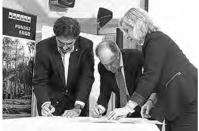
Los más destacados protagonistas de toda la cadena de valor de la foresto industria estuvieron presentes, entre otras autoridades públicas y privadas.

Con una trayectoria de 72 años, la Asociación Forestal Argentina realizó su habitual cóctel en el Campo Argentino de Polo de Buenos Aires. En el marco de esta tradicional reunión anual en la que confluyen los más destacados protagonistas de toda la cadena de valor de la fo-