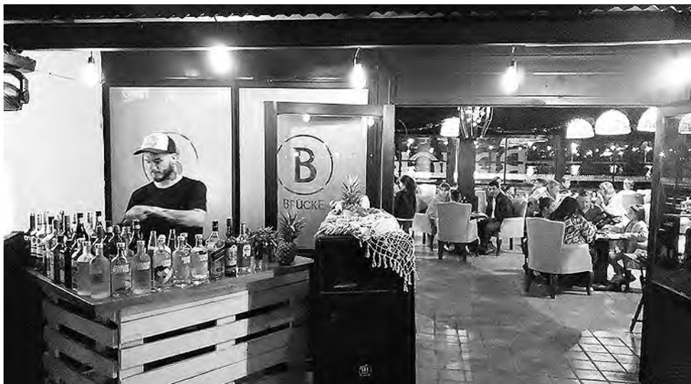
La cocina de Brücke dispone de platos elaborados, minutas, pizzas, picadas y barra de tragos. Por las tardes proveen de mate, yerba y una manta, para disfrutar gratuitamente.

Un nuevo establecimiento gastronómico se puso en marcha recientemente, se trata de "Brücke, Resto Bar & Eventos" que inauguró el pasado 3 de noviembre tomando la concesión municipal de la confitería de la Isla Grande en el Parque Recreativo Don Tomás de la capital pampeana. El día inaugural contó con la presencia del cantante Fidel Nadal, quien fue el responsable de abrir el espectáculo ante una gran cantidad de seguidores y público presente que participó de esta velada de inicio en el Parque Recreativo Don Tomás.