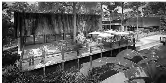
"Lodge": anglicismo que significa pequeña casa o cabaña en las cercanías de un parque, en un entorno natural. Un lugar de descanso, un refugio construido de manera permanente, con mínimo impacto ambiental, comprometido con la cultura local y que ofrece al huésped todo lo que necesita (y más) para su descanso.

Selvaje Lodge Iguazú, se construyó sobre un terreno