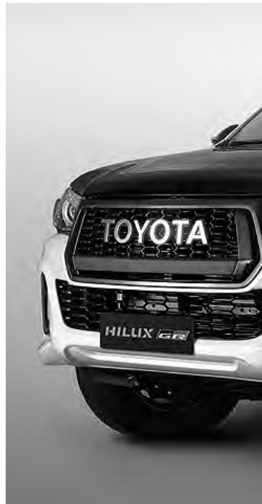
Es el primer vehículo de la marca en nivel global, concebido para su uso.

GAZOO Racing Company, además de ser la marca del grupo responsable de englobar las actividades de motorsport, nació con el propósito de desarrollar y evaluar nuevas tecnologías en los ambientes más exigentes del mundo de la competición. Para ello, se enfoca al mismo tiempo en la formación de recursos humanos e ingenieros que, en base a dichas experiencias y aprendizajes, puedan aplicarlos en diseñar vehículos cada vez mejores.