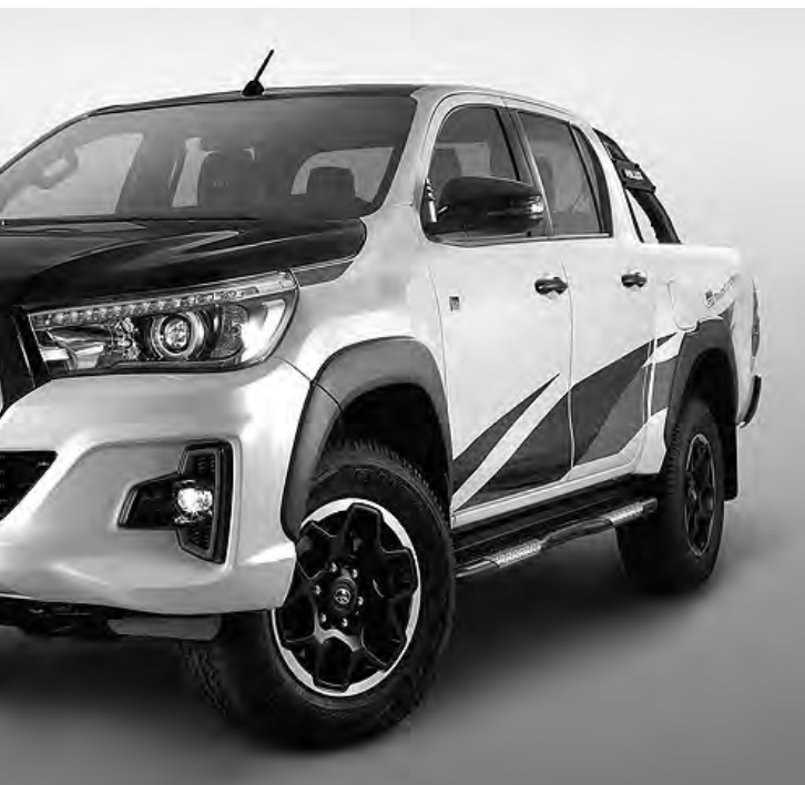
ca desarrollado en la región bajo la filosofía de "GAZOO Racing" a uso mayoritariamente off-road, en caminos rápidos de tierra y ripio.

ripi, con soporte directo de GAZOO Racing Company. La Hilux GR Sportse enfoca en generar en el conductor la sensación de adrenalina que se experimenta durante una carrera de rally: alta velocidad en caminos de baja adherencia. Para ello, setrabajó sobreel comportamiento de la suspensión modificando la dureza de los resortes y aumentando la capacidad de amortiguación reemplazando los amortiguadores por unos monotubo de mayor diámetro. Se logra así mejorar el control del conductor sobre el vehículo, y elevar la confianza de manejo en caminos accidentados de tierra y ripio a alta velocidad, manteniendo a su vez las capacidades propias de Hilux de confort de marcha y capacidad de carga. Se consigue además un vehículo más firme, con menor grado de roldo y muy sólido, así como una dirección más precisa, con una respuesta más lineal y progresiva en relación al giro del volante.