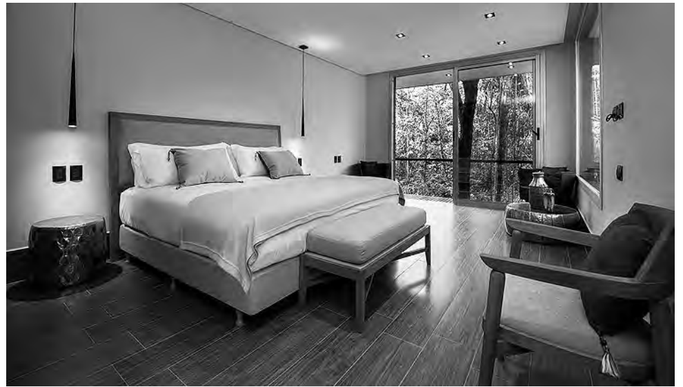
El nuevo establecimiento busca ofrecer una experiencia exclusiva -12 habitaciones para 24 pasajeros- logrando una comunión natural con el entorno de la Selva Yriapú.

Además, Slobayen adelantó que se está trabajando en el Corredor Naturaleza, "que tiene como objetivo que vayamos vinculando con Iguazú muchos otros atractivos naturales que permitan que los turistas vayan también a los Esteros del Iberá, al Impenetrable, a los saltos del Moconá, etc. Que sea un producto integrado. apuntamos al turismo fluvial, a las ruinas jesuíticas, entre otros atractivos. Esperamos que este proyecto sea exitoso y que haya muchos más proyectos como este que claramente es donde está el futuro de Misiones y de la Argentina", finalizó Slobayen.