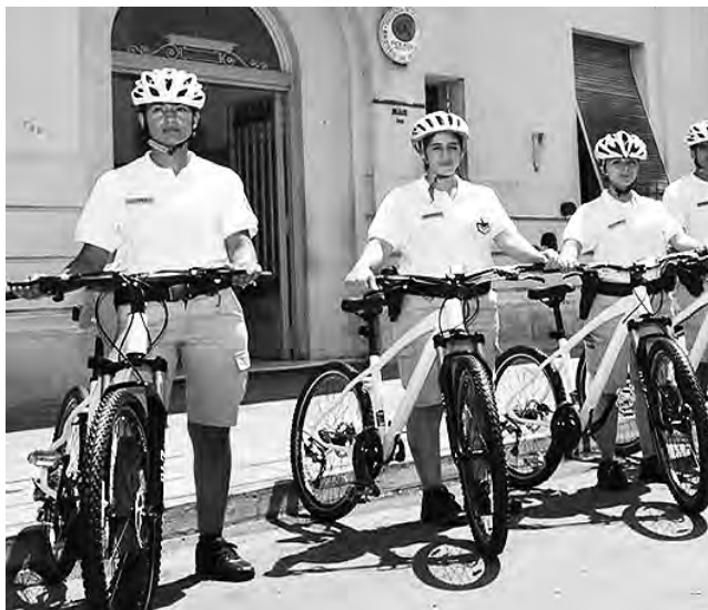
La Policía de Provincia de La Pampa, es una de las mejores equipadas en el interior del país y está muy modernizada, hasta con Patrullaje en Bicicleta.

El 30 de agosto se recuerda en La Pampa, la creación de la Policía Provincial.