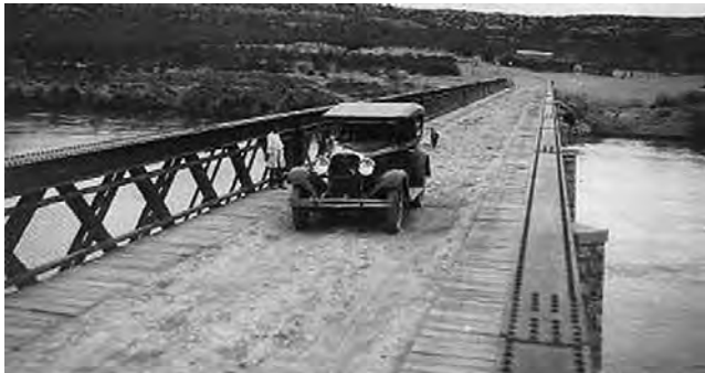
El viejo puente carretero que une La Adela (La Pampa) con Río Colorado (Río Negro) fue declarado Patrimonio Cultural de la Provincia recientemente, el 28 de marzo de 2018.