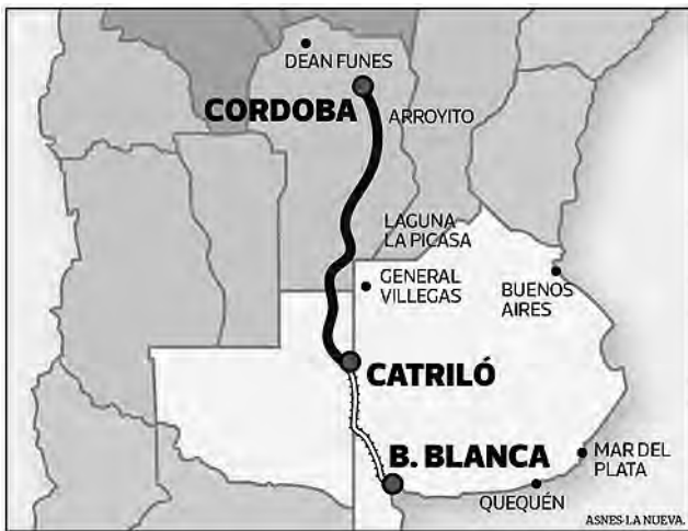
La traza de la Hidrovía sería hasta Catriló y desde allí, la carga se movería por tren a los puertos.