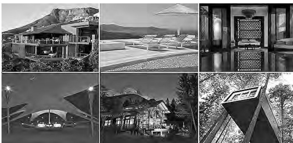
Un dato de color: Según "Booking.com", lo que más temen olvidarse los argentinos cuando viajan, es el juguete o peluche de sus hijos, su ropa interior, la malla y el kit de playa. Y por supuesto, el 70% teme olvidarse el celular o la Tablet.

El argentino busca, consulta, pregunta, lee, analiza y después concreta su viaje -resu-