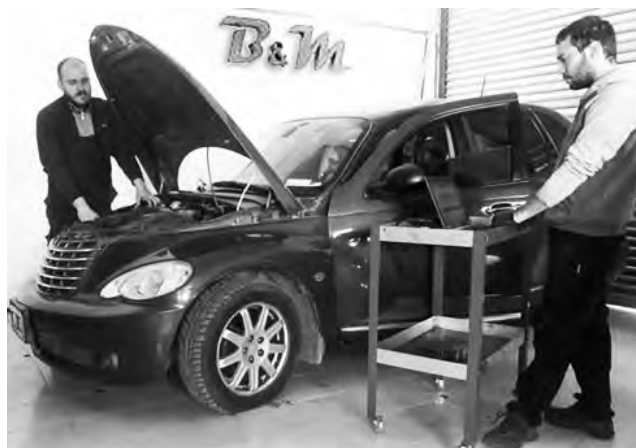
Si bien el principal factor es la falla humana, el mal funcionamiento o deficiencias que puedan tener los vehículos también cuenta y hay que hacer controles preventivos.