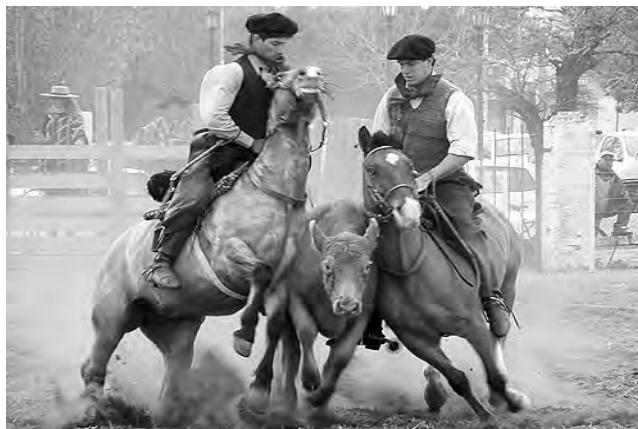
El ingreso al público será sábado y domingo, uno por Chaco y San Juan y otro por Av. Spinetto, contiguo al Restaurante. General $ 100, Jub. $ 80, menores 10 no pagan.

Durante este fin de semana se desarrolla la "8ª Exposición Provincial Del Caballo", en el predio de la Asociación Agrícola Ganadera de La Pampa, con más de 200 equinos en exhibición y realizando destrezas.