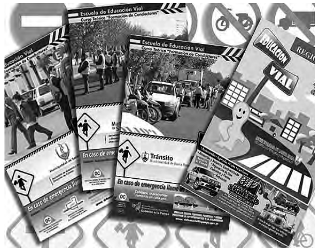
Desde hace más de 11 años, REGION ® Empresa Periodística edita un suplemento color sobre Educación Vial.

La fecha fue consagrada debido a que un 10 de junio de 1945 se produjo el cambio de mano de circulación de vehículos que a la usanza inglesa era hasta entonces a la izquierda.