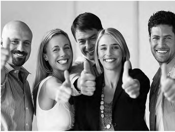
El estudio reveló que si los trabajadores pudieran elegir un entrenador y transformarlo en su jefe, ese sería "el Tigre" Ricardo Gareca, entrenador de Perú.

Al consultarles si creen que el Mundial es una motivación extra durante la jornada laboral, el 80% cree que la motivación no depende de eso. Al mismo tiempo, el 15% cree que traba-