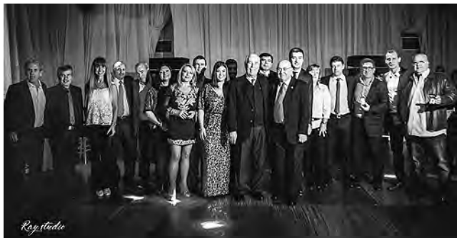
Foto de todos los profesionales que recibieron su reconocimiento (25 y 50 años) con integrantes de junta directiva.

Y el sábado 2, la tradicional "Cena Anual" en el salón de La Sociedad Rural de General Pico, donde se hizo entrega de un presente a los contadores matriculados asistentes y un especial reconocimiento a aquellos que cumplieron 25 y 50 años de matrícula con la entrega de una medalla de oro y reloj respectivamente.