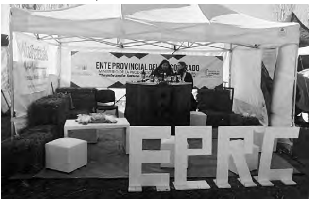
El Ente Provincial del Río Colorado, se hizo presente con su stand en la Gran Fiesta del Motociclismo Deportivo.