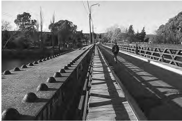
El viejo Puente Carretero de La Adela forma parte del Patrimonio Cultural provincial desde el 28 de marzo de 2018.