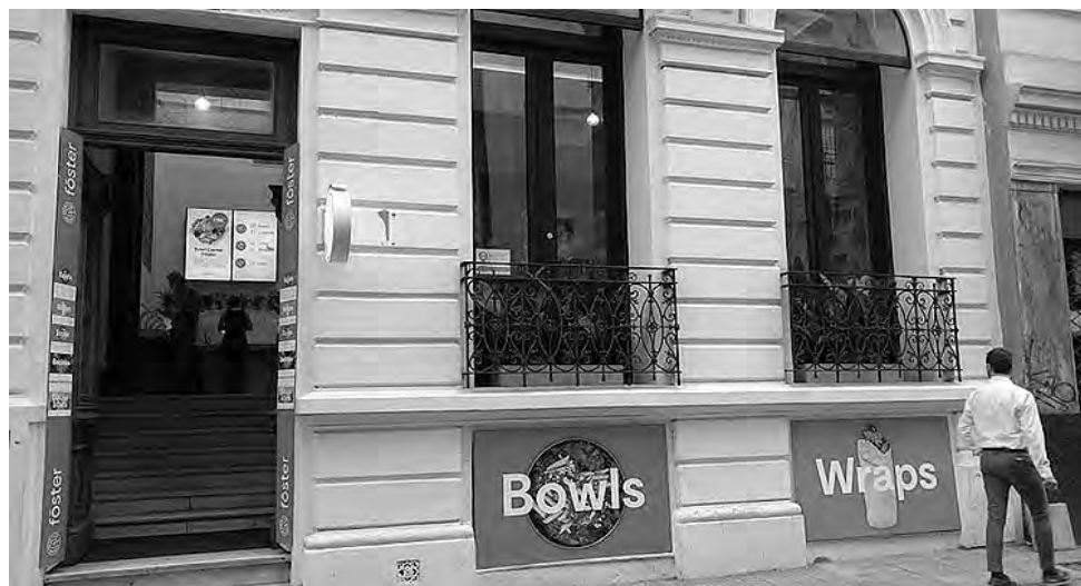
"Foster Nutrition" abrió en Tucumán 422, en pleno microcentro de Buenos Aires.

3- El menú elegido se comienza a realizar en la cocina, pero no en cualquier cocina: se trata de una terminal automatizada con cocineros capacitados en manejo de tecnología para que en poco tiempo puedan preparar pla-