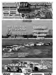
Tapa de la Edición 2017

previamente a la competencia, un suplemento color desplegable con todos los datos actualizados sobre posiciones en el campeonato y listado de pilotos de las tres categorías, con horarios, detalles del circuito y cómo llegar, información fundamental para quienes nos visitan.