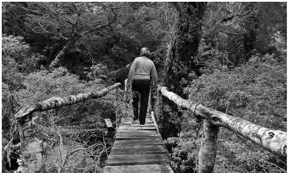
Recorrer el Parque Nacional Queulat, es una experiencia inolvidable, ideal para trekkings de baja, media y alta dificultad, donde se puede visitar el "Bosque Encantado".

Allí decíamos que de Chaitén en adelante, el punto central es el pueblo de La Junta, con pequeños hostales y residenciales sencillos, -amantes de hoteles de categoría, abstenerse-. El "lujo" en el lugar, es recorrer paisajes naturales excepcionales, a través de paseos por el Lago Rosselot, trekkings de todo el día para alcanzar miradores en el Parque Nacional Queulat o en Puyuhuapi,