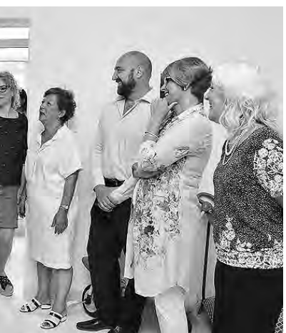
Secundario "Paulo Freire" de Santa Rosa. El Gobierno cercana a los $ 20.000.000

las provincias. La Pampa en la actualidad paga los mejores sueldos, los paga en término, pagó el bono, pagó la ayuda escolar de 2.500 pesos y a los docentes que tienen doble turno, 5.000 pesos. Creo que hay muchas formas de manifestar el reclamo y si bien acompaño la protesta, creo que La Pampa no se merece un paro".