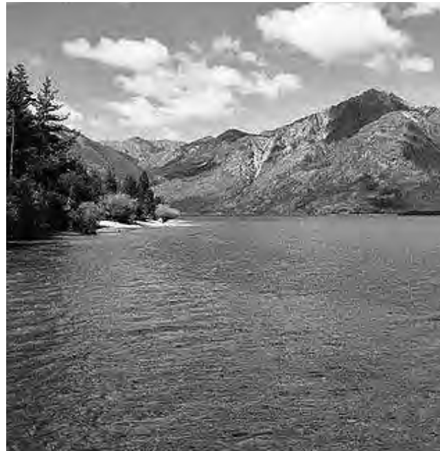
"El Hoyo", provincia de Chubut, es un pueblo sobre la Ruta Nacional 40 que hay que conocer. Repleto de atractivos naturales, exquisita fruta fina y paisajes deslumbrantes.

Pastos es un refugio a cielo abierto para el avistaje de aves de diferentes especies.