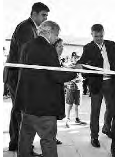
Con una inversión de más de $ 55.0 inauguraron dos escuelas en el Bar

Así lo definió la ministra de Educación. "Yo soy una defensora de la paritaria nacional, creo que logró nuclear a los gremios y definir un conjunto de pautas -no solo en lo salarial-, para trabajar al interior de