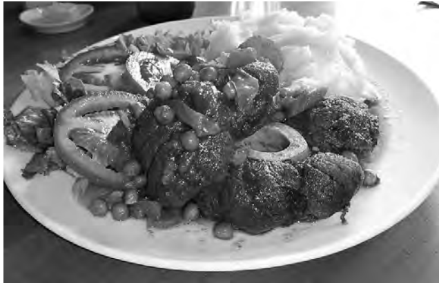
"No solo de salmón vivirá el hombre"... el parador de embarque en Caleta Gonzalo, nos sorprendió con una espectacular cazuela de osobuco, que calificamos con 10!