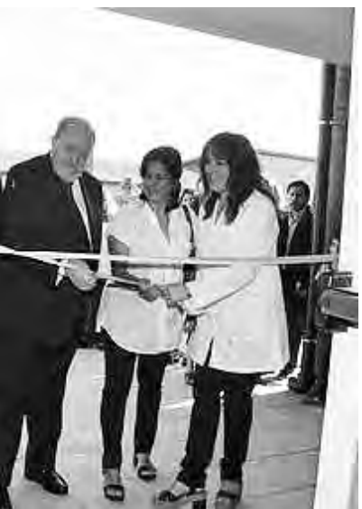
20.000.000 del Gobierno pampeano, se construye el Barrio 1.702 Viviendas de Santa Rosa.

El nuevo edificio, tiene una superficie cubierta de 600,00 m2, y en su progra-