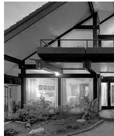
Casa construida con el sistema steel frame

El 'steel frame' o 'steel framing' es un sistema de construcción que se basa en estructuras metá-