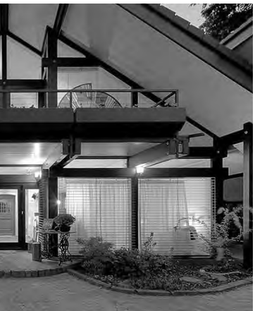
tema en seco Steel Frame.

(ver más en Revista "Concreto" que edita REGION ® - se puede retirar gratis de nuestra actual oficina provisoria de Kardec 896 esquina Independencia - o bajarla en PDF en: http://www.region.com.ar/productos/concreto/index.html )