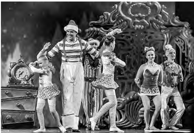
Disney se viste de fiesta en la Navidad en Orlando