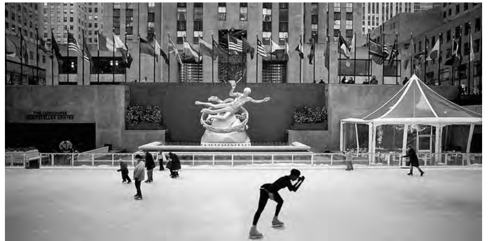
La Navidad blanca en el Rockefeller Center de N.Y., la más famosa del mundo

Además de vuelos y hoteles, "Despegar" ofrece también