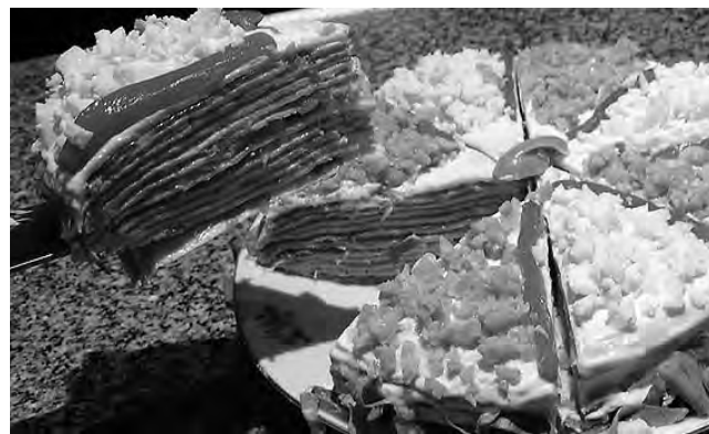
Las empresas proveedoras presentes en esta página, saludan a "Pizza Alegre" en su 18° Aniversario

Nuevamente a todos, muchas gracias y que tengan unas Felices Fiestas Familiares".