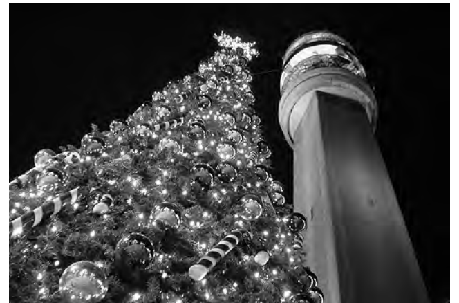
Clásico Árbol de Navidad Torre Entel de Santiago de Chile