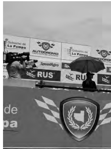
En el TC se destacó la victoria punta del campeonato. El

ACTC emitió un comunicado con los pilotos sancionados luego de la competencia de Toay, donde se analizaron algunas situaciones del fin de semana y se lanzó un comunicado con los pilotos sancionados.