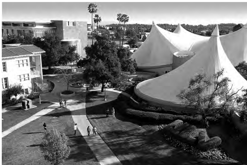
La "University of La Verne" de California, Estados Unidos, está recibiendo postulaciones para los meses de julio, setiembre de 2018 y enero, julio, setiembre de 2019.

En este momento, son ofrecidos los siguientes programas en University of La Verne: Advanced Topics in