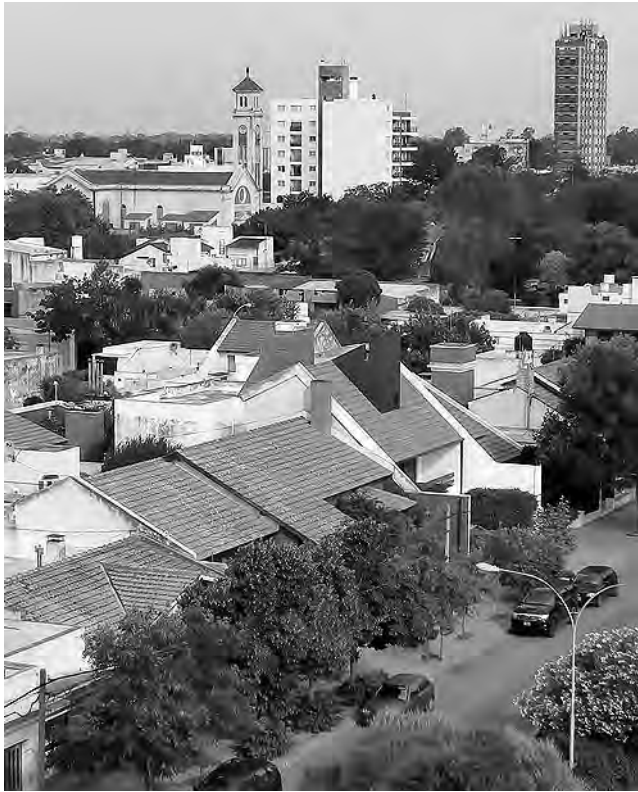
VIENE DE TAPA

La Comisión de Eventos, está conformada por funcionarios de todas las secretarías que integran la Municipalidad de General Pico.