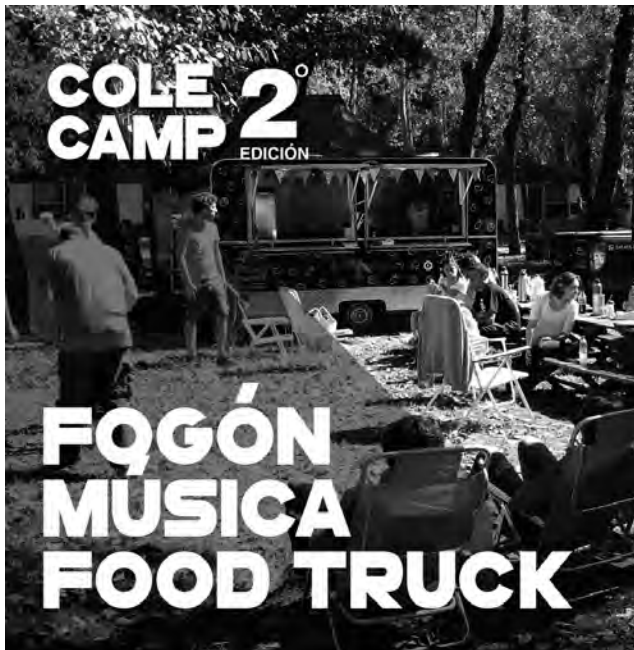
Desde el Club On Line de Emprendedores organizan el COLE Camp. Por primera vez se realizará en La Pampa.

Se viene un evento único a Toay, La Pampa, el fin de semana próximo del sábado 11 y domingo 12 de noviembre, un Campamento de Negocios donde asistirán Emprendedores y Empresarios de distintos puntos del país para capacitarse de una manera diferente, divertirse, cargar pilas y conocer mucha gente copada.