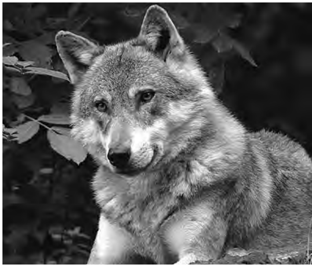
Nuestros perros, pertenecen a la clasificación, canis lupus familiaris, esto significa que son descendientes del lobo.

ción de forma o cualidades humanas a lo que no es humano) sumado al desconocimiento del lenguaje canino y el sometimiento a un estrés constante puede desencadenar actos agresivos que culminan con la mordida propiamente dicha, pero comenzó con mucho tiempo antes.