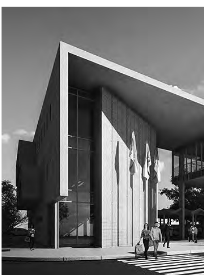
Imagen renderizada del Nuevo Edificio