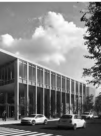
Edificio recién licitado en General Pico