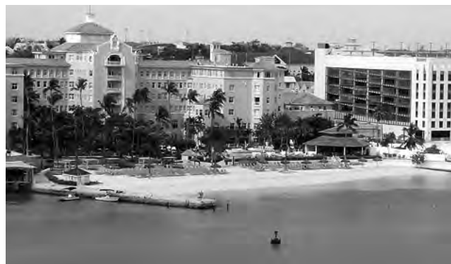
Imagen de la llegada a Nassau, la ciudad capital.

Bahamas es un archipiélago de 700 islas, siendo Nassau, New Providence, su capital. Cuenta también con lugares como Cable Beach, Eleuthera, Pink Sands Beach (posee playas de arena rosada) y Paradise Island -entre otras- lugares ideales para pasar unas vacaciones muy especiales y disfrutar sus bellezas paradisíacas y naturales.