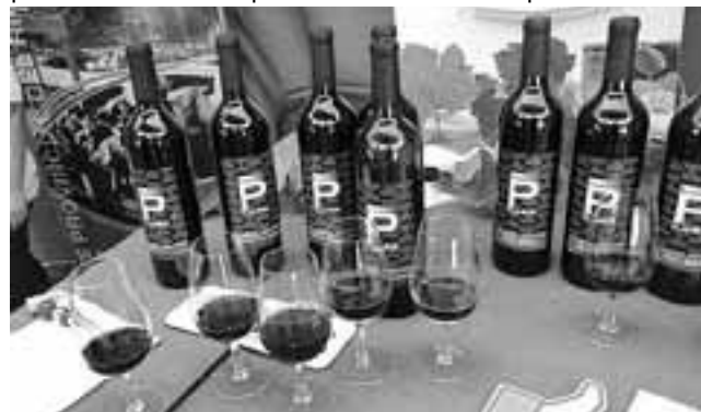
Hubo degustación del vino "Planicie" que se obtiene en Casa de Piedra, en la variedad malbec. Exquisito.

Por la noche, el escenario de la Muestra se vistió de gala con coloridos espectáculos musicales, donde participaron distintas bandas llegadas de toda la región.