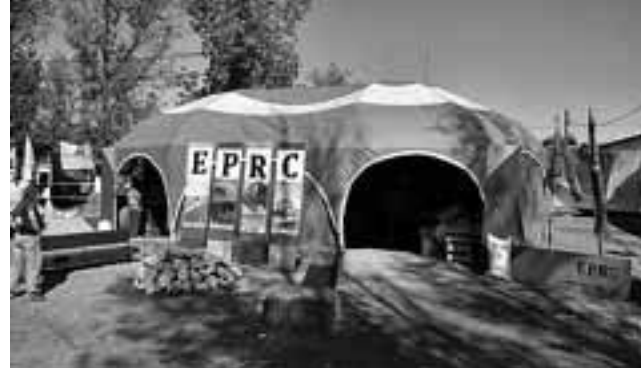
Carpa del EPRC, una de las más atractivas de la Expo.