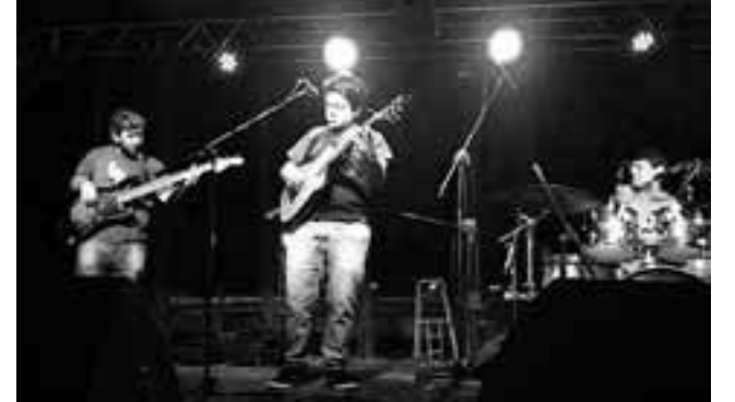
Buenos espectáculos animaron la noche sabatina.