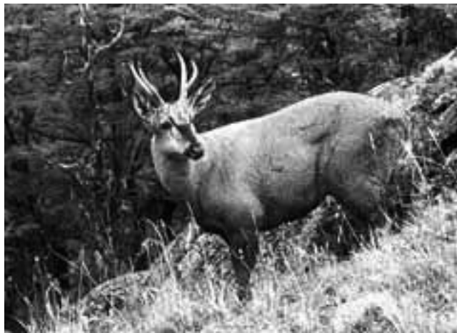
El Huemul peregrina los cerros del Parque Nacional Los Alerces con su andar tranquilo, entre la hierba, la piedra y la nieve, buscando alejarse de sus depredadores naturales y preservar su especie, hoy en peligro de extinción.

Sólo los machos tienen astas que pueden medir hasta unos 30 cm de longitud, son bifurcadas y a fines de julio las pierden de manera natural. Poseen grandes orejas que miden más de 20 cm. que actúan como pantallas que les permiten escuchar los mínimos sonidos. En su cara presenta una característica mancha oscura con forma de Y griega, que es visible solo en los machos adultos. El pelaje denso y grueso lo protege del duro clima, de las bajas temperaturas invernales y del