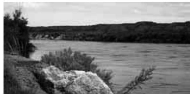
Río Colorado, límite natural entre las provincias de La Pampa y Río Negro, que baña las costas en un extenso recorrido de 500 kilómetros de extensión.

Sabemos que el agua es imprescindible para el ser humano y todos los seres vivos, sin ella es imposible la vida. Con el objetivo de estimular en todos los argentinos la conciencia en el uso de los recursos hídricos, se estableció que el 31 de marzo se celebre el Día Nacional del Agua, por Resolución Ministerial N° 1630 del año 1970. El agua es un recurso renovable, limitado, frágil y vulnerable. Si bien abunda en el planeta, solo el 3% es dulce, apta para el consumo humano. La escasa reserva de agua en el mundo, sometida a una presión sin precedentes, a causa del crecimiento demográfico, la