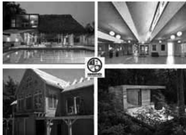
La madera continúa su franca expansión nacional y conquista de cada vez mayores espacios, gracias a sus enormes ventajas ambientales y de sustentabilidad.

Un estudio reciente realizado por la Universidad Católica Argentina (UCA) indica que el déficit habitacional afecta al 20,5 % de las familias argentinas, calculando que para resolver este problema crónico se necesitan unas 3 millones de viviendas en todo el territorio nacional. Ya incluida en el Plan Procrear y ahora nuevamente propulsada por un convenio de reciente firma con las autoridades nacionales de turno, la madera se presenta como la vía más rápida, sustentable y con mejores