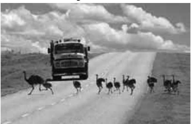
Los caminos son para todos y hasta los compartimos con nuestra fauna autóctona. La foto de REGION® -que ha recorrido el mundo en diversas publicaciones turísticas nacionales y extranjeras-, fue tomada en nuestra Ruta Provincial N° 20 en el Sur pampeano.

El 5 de octubre de 1925, se desarrolló en Buenos Aires el Primer Congreso Panamericano de Carreteras y de allí se tomó la fecha para esta celebración anual.