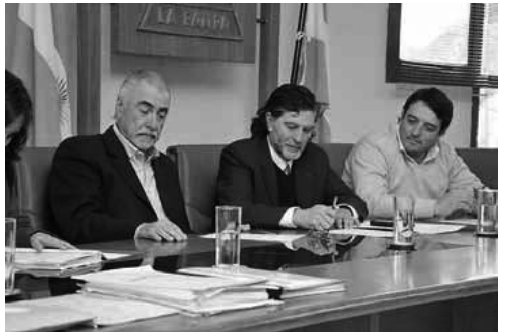
Fuerte inversión del Gobierno para la reconstrucción de un tramo de la Ruta Provincial N° 102, la obra incluye uno de los ingresos a General Pico. En la Ruta Provincial N° 1, avanzan los trabajos para los que se han destinado otros $ 126 millones.

Rainone resaltó la importancia de la obra no solo