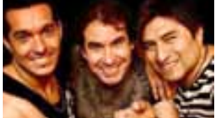
-Vie. 9 a las 21:30 hs: folclore con "Los Caldenes". $ 170. -Dom. 11 a las 18 hs: Popurri canta y cuenta. $ 60