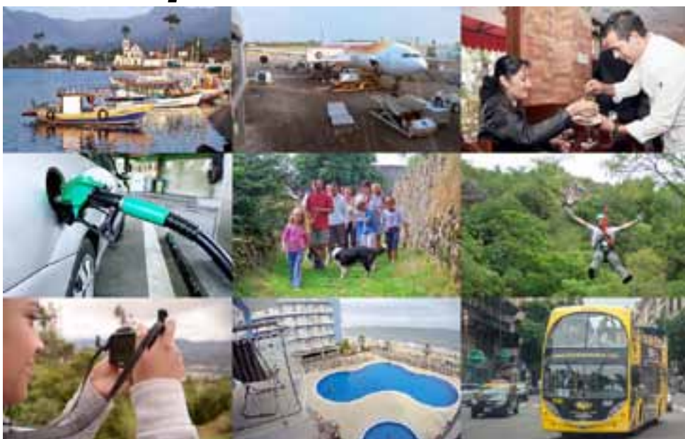
Varios funcionarios del Gobierno Nacional se han manifestado en contra de que haya "muchos feriados" señalando que Argentina necesita más y no menos. No obstante otros dirigentes advierten que el sector turístico nacional, conformado por una multiplicidad de rubros y trabajadores asociados significan un segmento que mueve un valor millonario económico de gran escala que las autoridades deberán evaluar.

Hasta el momento, el Ministerio del Interior de la Nación lo que no hizo es incorporar