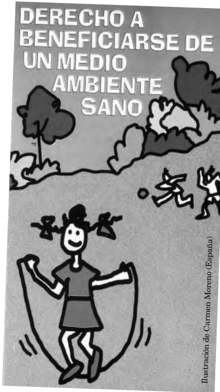
Ilustración de Carmen Moreno (España)

Habían pasado unos días de su primer cumpleaños y una tormenta feroz arruinó nuestros planes de pileta. Cuando amainó, le puse