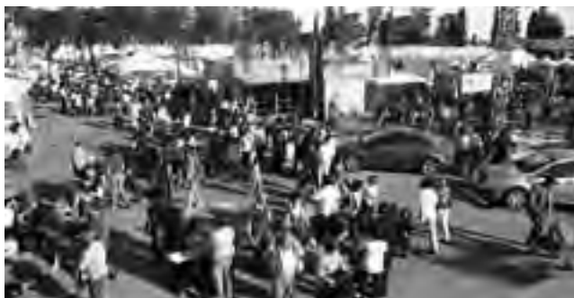
Este fin de semana es la 84ª Exposición Rural de General Pico. Este año, la novedad será el "Espacio Cadena Agroindustrial". El IPCVA estará presente.