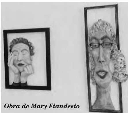
Obra de Mary Fiandesio

El Espacio Artístico de Diario del Viajero , Avenida de Mayo 666, Buenos Aires, continúa presentando la muestra Mandatos Patriarcales y algo más , de las artistas