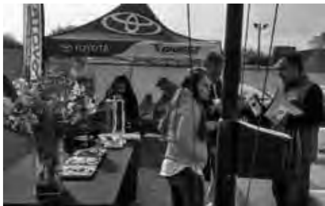
La buena y clara presentación de los vehículos, junto a la atención al público de manera muy esmerada, no tiene antecedentes de este buen nivel de comercialización en la capital pampeana en este rubro.

A todo esto, se sumó al lanzamiento del concesionario pampeano, la participación de las más importantes entidades crediticias como los bancos "BBVA Francés"; "HSBC"; "Santander" y lo habitual del "Toyota Financial Services", que pusieron a disposición importantes líneas de crédito que en gran manera favorecieron las compras. Además, las ventas de usados contaron con