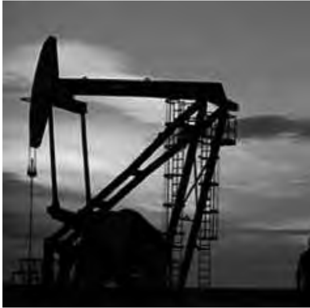
Área petrolera pampeana en 25 de Mayo

En 2015, durante una reunión de la Comisión de Legislación General de la Cámara de Diputados de La Pampa, se emitió el despacho unánime aconsejando la aprobación de una Ley que promulgara la celebración del "Día del Petróleo de La Pampa", en la fecha 5 de septiembre de cada año.