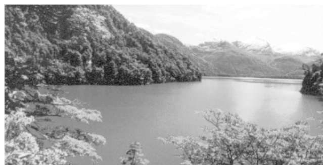
El paisaje de la Patagonia esta caracterizado por los diversos ríos y lagos que recorren su geografía

Un día, de pronto, descubrimos a un hombre de gigantesca estatura, quien, desnudo sobre la ribera del puerto, bailaba, cantaba y vertía polvo sobre su cabeza... Era tan alto él, que no le pasábamos de la cintura y bien conforme; tenía las facciones grandes, pintadas de rojo y, alrededor de los ojos, de amarillo, con un corazón trazado en el centro de cada mejilla... Los pocos cabellos que tenía, aparecían tintos en blanco, vestía piel de animal, cosida sutilmente en las puntas... Para Pigafetta, además, el sur se convierte en la Regione Patagonia y en la cartografía comienza a figurar una Regio Patagonum abarcando toda la geografía del extremo sur. ¿Por qué, junto a detalles tan verosímiles, Pigafetta fantasea con estos gigantes? Tres siglos más tarde, el eco de la estatura de los Patagones sigue inquietando, pero ya despojada de la anterior connotación fantasiosa.