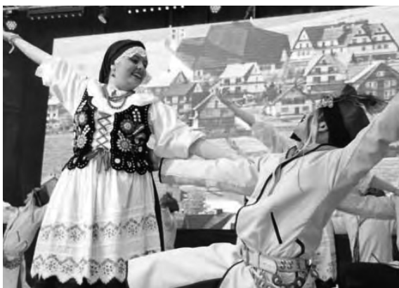
En la Fiesta del Inmigrante participan integrantes de las colectividades y del teatro comunitario de Berisso.

Algunas de las actividades consistirán en el encendido de la llama votiva, Colectividad Griega, calle 8 y 164; posta del inmigrante, Monumento a los inmigrantes, Parque Cívico, Av. Montevideo entre calle 10 y 11; entrega de diplomas a los inmigrantes con 50 y 75 años de residencia en la Argentina. También maratón del inmigrante; representación del desembarco de los primeros inmigrantes, Av. Montevideo y Nueva York; Regata del Inmigrante, desde Berisso a Puerto Sauce, Uruguay. Habrá selección de la Reina Provincial del Inmigrante; stand de comidas típicas y baile de las colec-