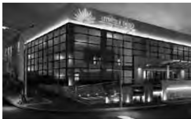
Hotel “UTHGRA SASSO” Casino, categoría 4 estrellas, que el gremio tiene en Mar del Plata

El 2 de agosto se recuerda el acta fundacional de la Federación Obrera Argentina de la Industria Hotelera (FOAIH), y es para el gremio, un día de importancia histórica. Nada más y nada menos, que sus orígenes.