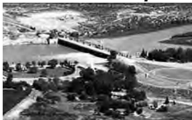
Foto aérea del Río Colorado, límite natural de La Pampa, donde se aprecia el Puente-Dique “Punto Unido”

Es un reclamo que venimos haciendo desde esta página hace años. Finalmente parece que la operatividad del estratégico dique derivador de nuestro río Colorado, el más importante que atraviesa la provincia unos 500 km, podría mejorar todo el Sistema del Aprovechamiento