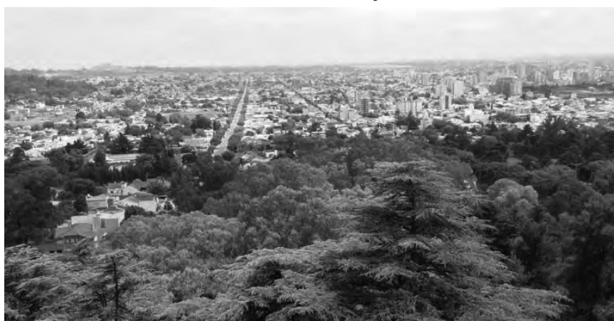
La ciudad de Tandil desde el Mirador a 286,50 metros de altura