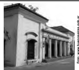
Los ángulos de Buenos Aires Museo Histórico Coornelio Saavedra

Buenos Aires, República Argentina - Miércoles 27 de julio de 2016 - N° 1526 - Año XXX