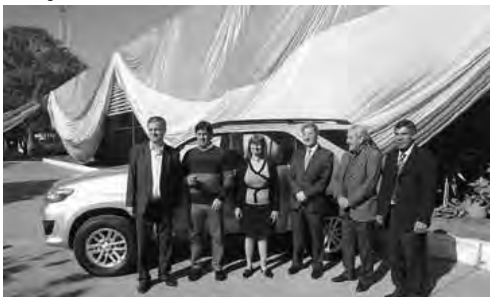
Dos escuelas de la provincia de Chaco recibieron vehículos no rodantes y equipamiento con fines educativos de parte de Toyota Argentina, como parte de su programa "Educación sobre ruedas". El beneficio alcanzó además a la provincia de Corrientes y a CABA.

"Educación sobre ruedas" tiene como objetivos primarios fortalecer los procesos de aprendizaje de escuelas técnicas con orientación me-