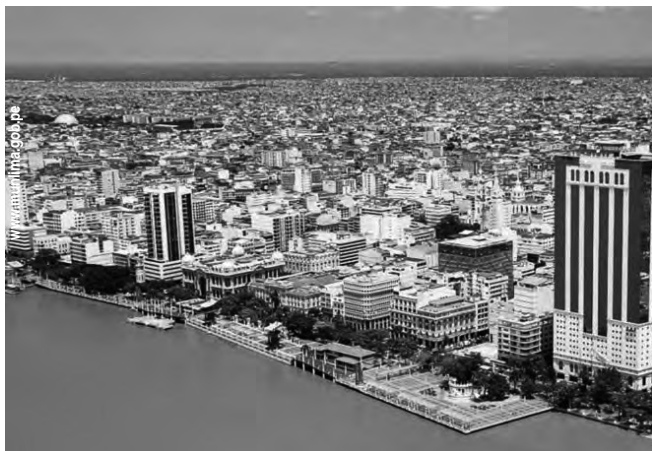
Antes Calle de la Orilla, ahora Malecón Simón Bolívar, icono turístico de Guayaquil, Ecuador. Su historia nace desde 1820 cuando era la primera imagen de la ciudad a los viajeros que se transportaban en barco.

Guayaquil, Ecuador - SAHIC South American Hotel and Tourism Investment Conference . Evento anual destinado a promover los negocios de hoteles, turismo y proyectos de Real Estate relacionados con la región sudamericana. (Hasta el 27/9) Informes: www.sahic.com