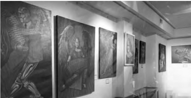
Parte de los cuadros expuestos en el Espacio Artístico de Diario del Viajero