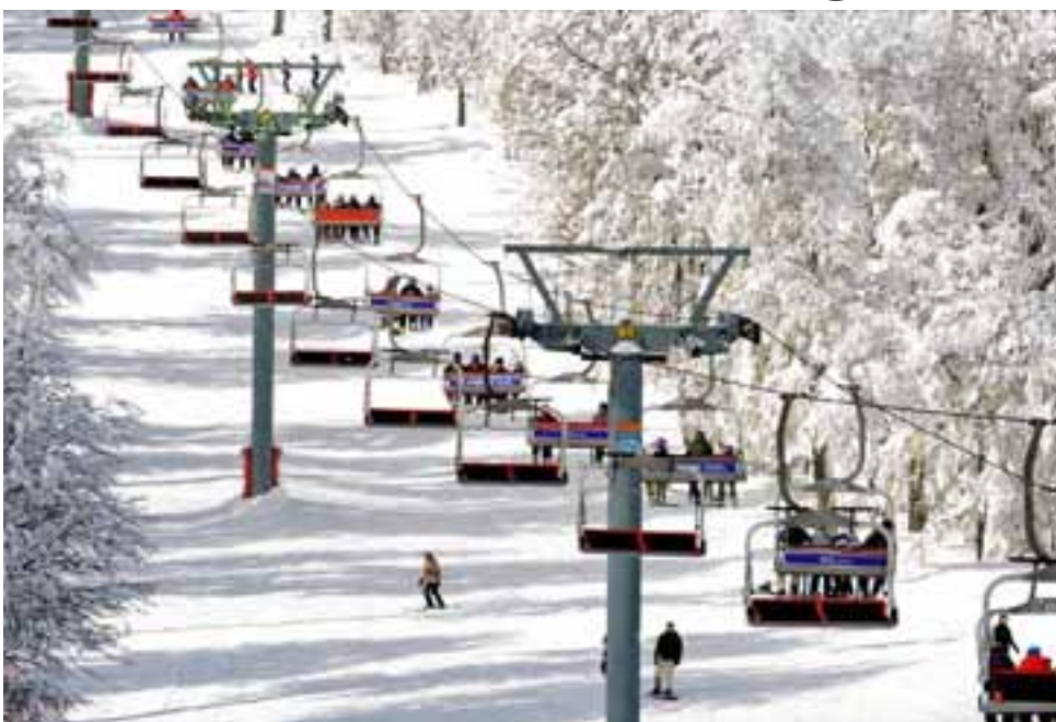
"Chapelco Ski Resorts" en la temporada pasada recibieron la máxima distinción de "World Ski Awards", siendo elegidos como mejor estación de esquí de la Argentina 2015.

San Martín de los Andes hizo el lanzamiento oficial desde Buenos Aires con una actividad organizada por Neuquentur, con el apoyo del Consejo Federal de Inversiones (CFI), presentando los destinos y centros de esquí de la provincia así como las novedades programadas para este año en cada uno de los mismos. Los acompañó la gente de "Chapelco Ski Resorts" que en la temporada pasada recibieron la máxima distinción de "World Ski Awards", siendo elegidos como mejor estación de esquí de la Argentina 2015.