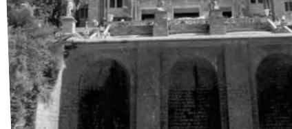
Impactante Museo de Arte de Cataluña