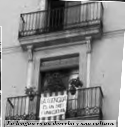
La lengua es un derecho y una cultura