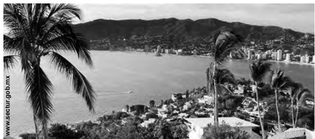
Acapulco, en la costa de Guerrero, México

Acapulco, México - 29° Reunión Internacional de Verano de Aplicaciones industriales. Un evento para los sectores que se vinculan con la generación, transmisión, distribución, control y uso de la energía eléctrica. (Hasta el 23/7) Informes: http://www.ieee.org.mx/