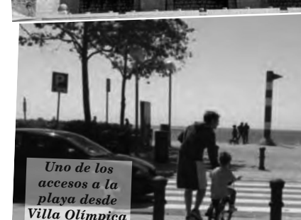
Uno de los accesos a la playa desde Villa Olímpica