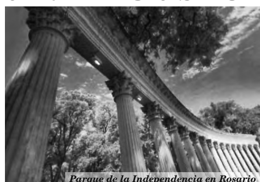
Parque de la Independencia en Rosario

Está dirigido a profesores y estudiantes de turismo, educación física, periodismo, seguridad y servicios médicos; empresas de turismo, deportivas, multimedia, seguridad y servicios médicos, dirigentes, entrenadores y atletas. Durante las jornadas habrá conferencias y talleres participativos con disertantes de asociaciones, federaciones y confederaciones deportivas de nuestro país y el extranjero. Además se compartirán experiencias de los gobiernos de ciudades y provincias donde se abor-