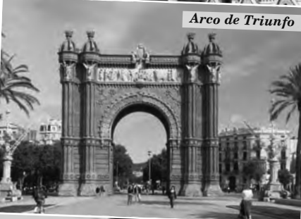
Arco de Triunfo