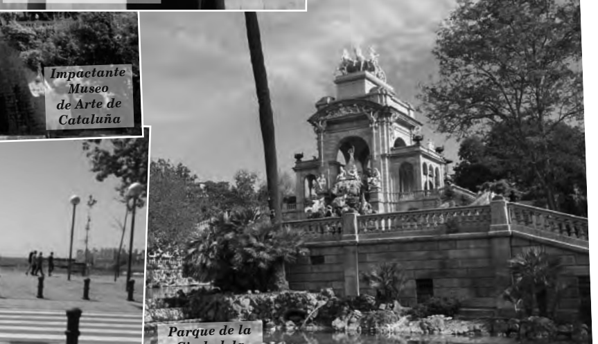
Parque de la Ciudadela