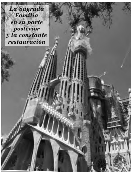
La Sagrada Familia en su parte posterior y la constante restauración