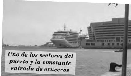
Uno de los sectores del puerto y la constante entrada de cruceros