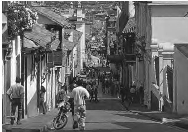
Barrio La Candelaria, en la ciudad de Bogotá, Colombia

Bogotá, Colombia - FANYF 2016 Feria Andina de Expansión de Negocios y Franquicias . Se trata de un encuentro en donde se promocionan las diferentes franquicias y negocios del país. (Hasta el 7/7) Informes: http://www.fanyf.com