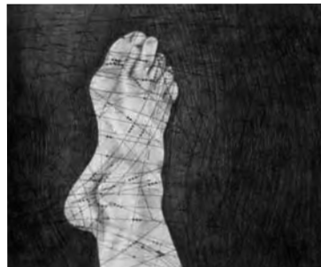
Pie derecho, obra de V. Gregory