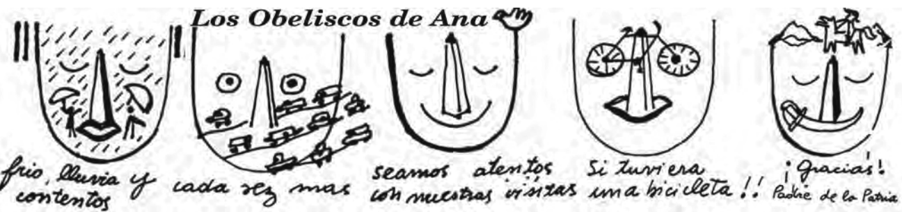
frio, lluvia y cada vez mas contentos seamos atentos con nuestras visitas Si tuviera una bicicleta!! ¡Gracias! Padre de la Patria