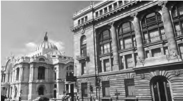
Vista de la ciudad de México, a la izquierda el Museo de Bellas Artes y a la derecha, el Banco de México

México DF, México - Salón Chocolate y Cacao. Se expondrán materias primas y tecnología de elaboración y las tendencias del mercado actual. Los amantes del chocolate podrán disfrutar y conocer la amplia gama de chocolates y el origen e historia del cacao. (Hasta el 3/9) Informes: www.tradex.mx/chocolates/