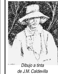
Dibujo a tinta de J.M. Caldevilla