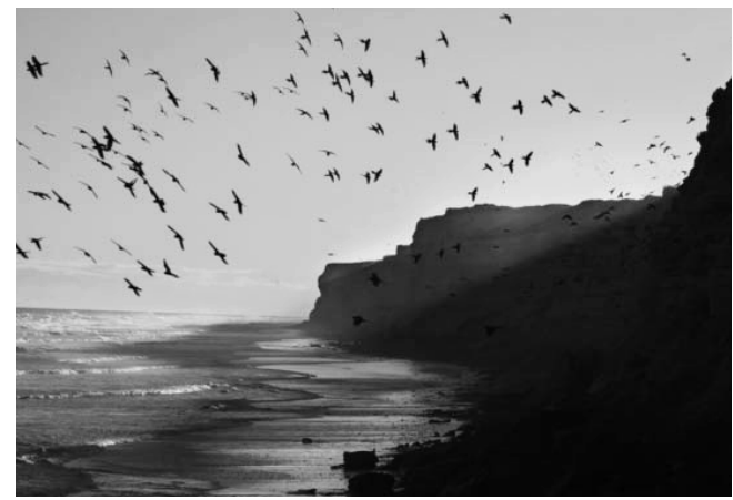
En Viedma, hay unos 35.000 nidos de loros barranqueros, emplazados a lo largo de 12 kilómetros de acantilados que dan al océano Atlántico

el sur desde 1934, en que Bustillo dio camino al cambio de Bariloche y Nahuel Huapi, de allí, un creciente bienestar a nivel mundial, correlacionado con la asistencia al ser humano en su tiempo libre, de una tecnología de apoyo en comunicaciones y transporte que han hecho accesible las comarcas corredores y las regiones de nuestro amplio planeta como opción de disfrute, salud o enriquecimiento cultural.