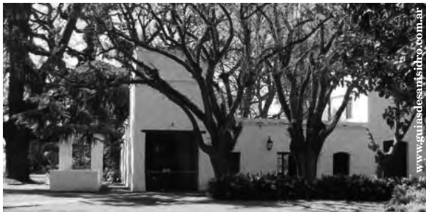
Museo Honorio Pueyrredón, patrimonio cultural de San Isidro

El Centro de Guías de Turismo de San Isidro llevará a cabo durante el mes de junio , visitas guiadas a pie y gratuitas.