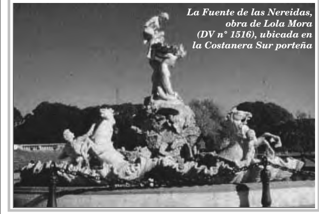
La Fuente de las Nereidas, obra de Lola Mora (DV n° 1516), ubicada en la Costanera Sur porteña

Francisco López franlopez1946@hotmail.com