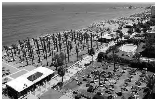
Torremolinos, Málaga, España

Torremolinos, España - Euroal Salón Internacional de Turismo, cita en la que tanto organismos oficiales como empresas privadas internacionales realizan contactos y crean alianzas comerciales. Contará con workshops y reuniones con touroperadores internacionales. (Hasta el 7/6) Informes: www.euroal.net