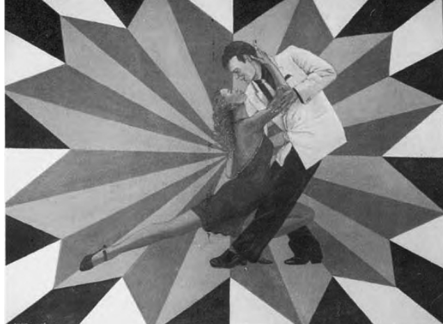
Milongueando, obra de Brígida Nocera

Muestra de pinturas de Brígida Nocera (DV n° 1326, 1327, 1365, 1406, 1427) que se inaugurará el viernes 3 de junio a las 19 en la Academia Nacional del Tango, Av. de Mayo 833 piso 1°, Buenos Aires. Las pinturas tienen un profundo contenido poético vinculado con el mundo del tango, en la música y la danza. Puede visitarse de lunes a viernes de 15 a 20, hasta el jueves 30 de junio. Informes: www.brigidanocera.com