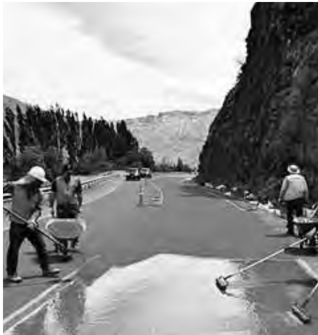
Profesionales, técnicos y operarios chilenos trabajaron en la aplicación de los sellos de alta fricción en los kilómetros 86, 87 (Curillínque) y 129 (Vacas Muertas), sectores que en condiciones extremas presentan formación de hielo en la calzada.