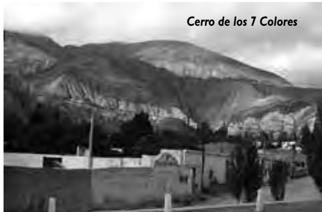
Cerro de los 7 Colores