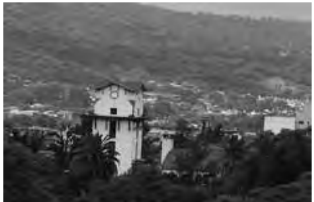
El Abra Santa Laura, es el límite entre las provincias de Salta y Jujuy. La ruta sinuosa nos interna en la montaña tupida de vegetación y en una de tantas curvas, aparece San Salvador de Jujuy en todo su esplendor.

En ediciones anteriores divulgamos el recorrido en vehículo de un viaje al Norte Argentino, con salida desde Santa Rosa y como destino final la Quiaca. En la 1ra parte comentamos el trayecto Santa Rosa - San Juan - La Rioja (ver REGION® N° 1.205). En la 2ª, La Rioja - Catamarca - Tucumán - Salta (ver REGION® N° 1.206), hoy continúa con la 3ra y última parte.