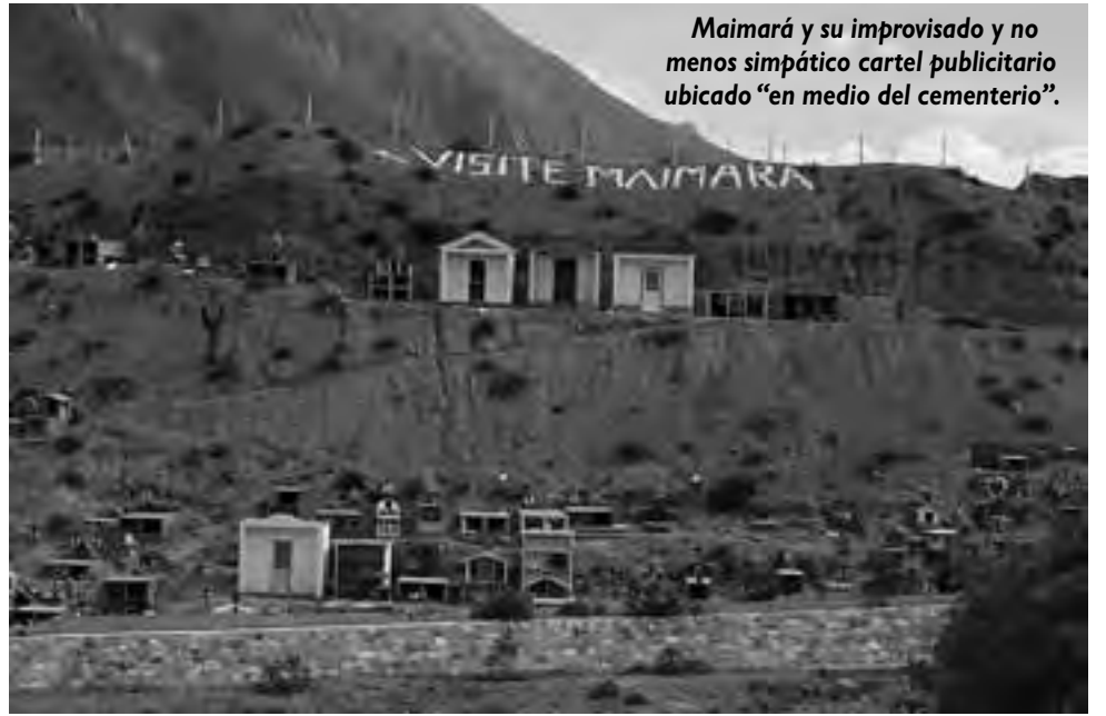
Maimará y su improvisado y no menos simpático cartel publicitario ubicado “en medio del cementerio”.

-Atención: al llegar al cruce con la RN 52, tomar al izquierda ca-