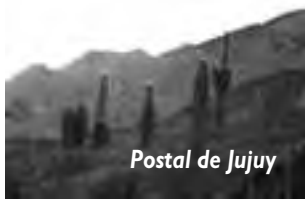
Postal de Jujuy

-Todo este trayecto de la RN 9 hasta casi el límite con Bolivia, es lo que geográfica y turísticamente se conoce como la «Quebrada de Humahuaca», un extenso valle montañoso irregular de 155 kilómetros de largo, camino del Inca antes de la llegada de los españoles y patrimonio cultural de 10 mil años de antigüedad.