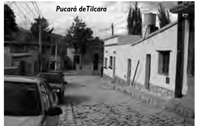
Pucará de Tilcara