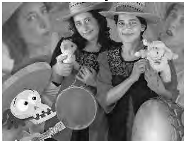
Desde el lunes 13 de julio, hay una intensa actividad teatral para los chicos. En esta edición, todas las funciones y precios día por día. Foto: "Ekekos y Calacas"

A partir del lunes 13 de julio comienzan una importante actividad teatral en Santa Rosa, en las salas del “Español” y “ATTP”, con espectáculos de circo y teatro para toda la familia, con la participación de artistas de nuestra provincia y de provincias vecinas. El cine para los más chicos también se expresa en las salas del “INCAA” y las 3D