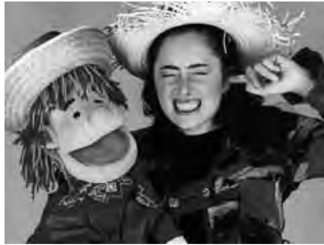
"Aguamarina" es un espectáculo que se ha representado en más de 50 ciudades en 6 países y se presentará en Santa Rosa. Un original repertorio, compuesto por canciones provenientes de distintas regiones de Latinoamérica.

-Sábado 25 a las 16.30hs: Delirium Circus