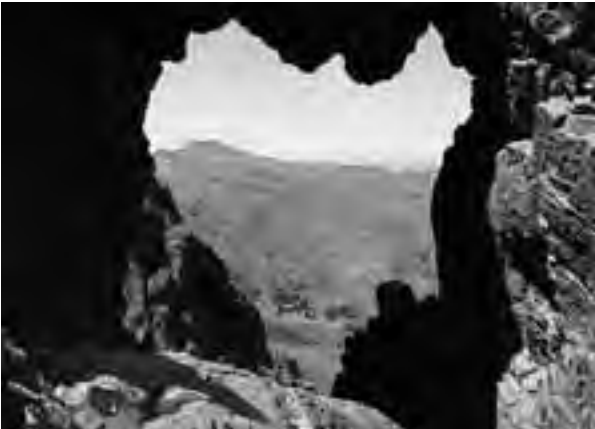
En el Parque Provincial de Sierra de la Ventana se pueden hacer escaladas de mediana dificultad.