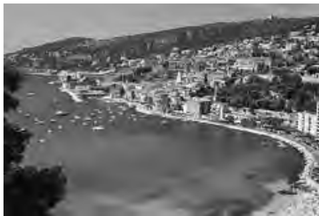
Para destacar, las playas de Villefranche-sur-Mer cerca de Niza, sencillamente increíbles.

Es uno de los países del mundo con mejores playas. Por algo son líderes en Banderas Azules año