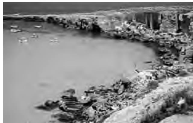
La playa italiana Cala Rossa en isla de Favignana, Sicilia. Un paraíso virgen.

Si elegimos una de las más famosas, debemos mencionar a San Remo, impuesta por los artistas, pero Cala Rossa en isla de Favignana, Sicilia, es el top en belleza.