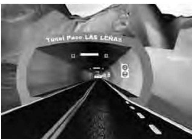
El proyecto propone construir un túnel binacional a casi 2.000 metros de altura y desarrollar la infraestructura complementaria para avanzar en el proceso de integración, generando la mejor alternativa de conectividad permanente en Chile central con Argentina e integrando el Eje Mercosur Porto Alegre-Buenos Aires-San Luis-San Rafael hacia Rancagua-San Antonio-Santiago-Valparaíso.