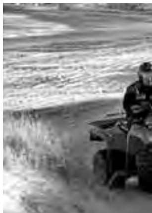
Si bien Las Grutas es un destino marítimo, en época ya que se pueden hacer

za es una de las más atractivas. La recomendación aquí es conocer el Cañón del Atuel, presencia viva de los orígenes del mundo, donde el viento y la lluvia tallaron las más variadas esculturas naturales. Le sugerimos hacer el camino 'en descenso' y en subida, razón por la cual es mejor trepar por asfalto hasta el dique El Nihuil y descender por el serpenteante camino que bordea el río Atuel, hasta Valle Grande.