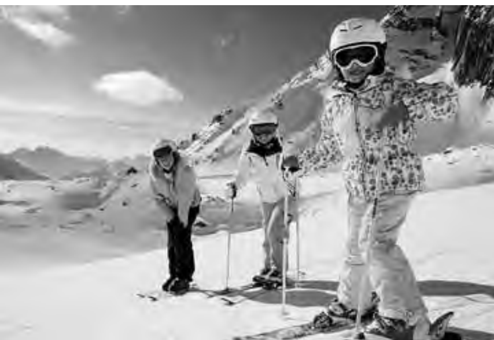
La opción de destinos con nieve abre un abanico importante de posibilidades en nuestro país, en especial dentro de nuestra Región Patagonia, con pistas excelentes y abundancia de servicios.

Como anticipamos cada año en esta fecha, desarrollamos un informe de cómo será el receso escolar vacacional 2015 en todo el país.