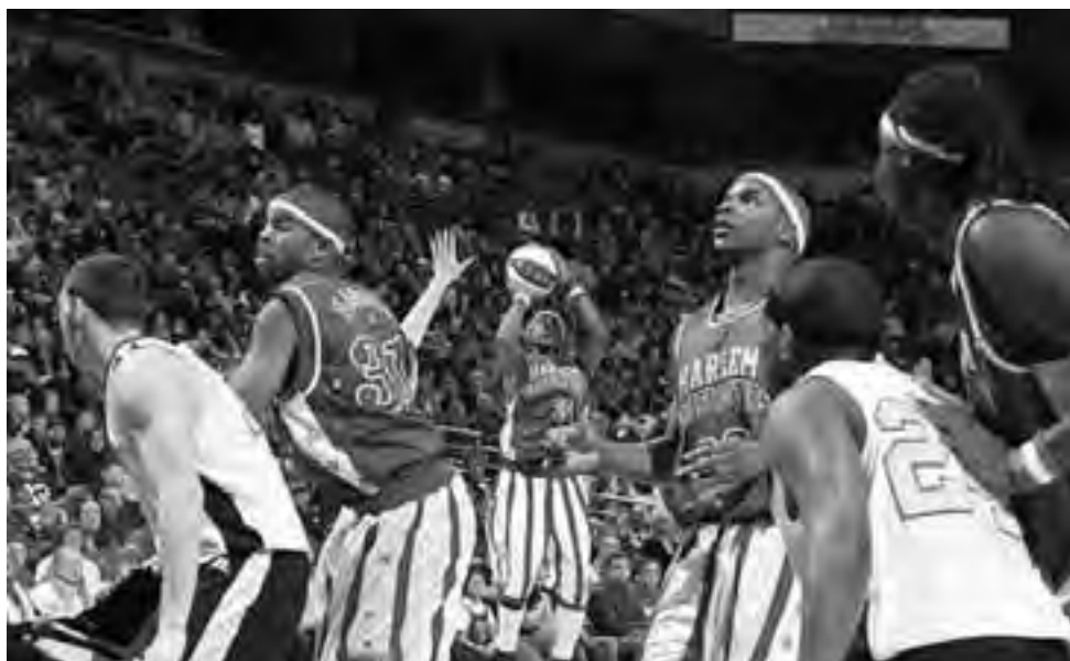
El viernes 17 de julio a las 21 hs los Harlem Globetrotters harán su show en el gimnasio del Club Estudiantes de Santa Rosa. Las entradas anticipadas (desde $ 330 hasta $ 660) están en venta en "Corner", de Cnel Gil esquina Lagos.

Fundados hace 89 años y hasta la fecha, "The Harlem Globetrotters" han recorrido más de 120 países de los cinco continentes jugando al básquet y entreteniendo. En 2011 se presentaron en