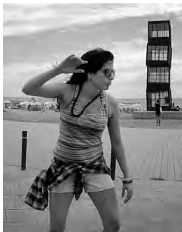
"La Barceloneta" de la "Comunidad Catalunya" en la inmensa ciudad de Barcelona, es turísticamente la más famosa y convocante, no solo por sus bondades como playa, sino por la especial 'movida' joven y su intensa actividad cultural.