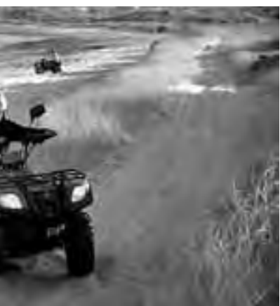
mo netamente de verano, tiene su atractivo en esta er excursiones interesantes en cuatriciclos.

La visita a Potrero de Los Funes -donde parte de la ruta recorre el autódromo internacional junto al lago-; el Dique La Florida; el pueblo minero de La Carolina; la bajada entre las sierras hasta San Francisco del Monte de Oro y la nueva Ciudad de La Punta, donde se encuentra una copia del Cabildo de Buenos Aires, pero completo. No deje de visitar en su viaje, el Monumento al Pueblo Puntano de la Independencia, en Las Chacras, a minutos del centro.