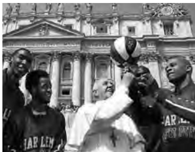
Los Harlem Globetrotters se han dado el gusto de visitar la Plaza San Pedro y practicar sus trucos con el Papa Francisco a quien han nombrado como "Miembro Honorario del Plantel"

Argentina con su gira "Four Times the Fun"; en 2013 lo hicieron con mayor éxito aún con "You Write The Rules" y ahora tendrán la tan ansiada revancha con los exigentes Washington Generals, a quienes no enfrentan desde hace cinco años.