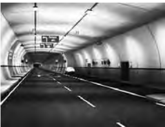
El túnel tendrá 11,5 kilómetros de largo y podría estar abierto los 365 días de año, especialmente en invierno.

Respecto al centro turístico, dijo que "las Leñas está activo, hay buena nieve y hay habilitados nueve kilómetros de pistas". González dijo que a esta altura, Malargüe tiene reservas activas, "ya que se vienen las vacaciones de invierno escalonadas de todo el país. También esperamos la de nuestros hermanos chilenos".