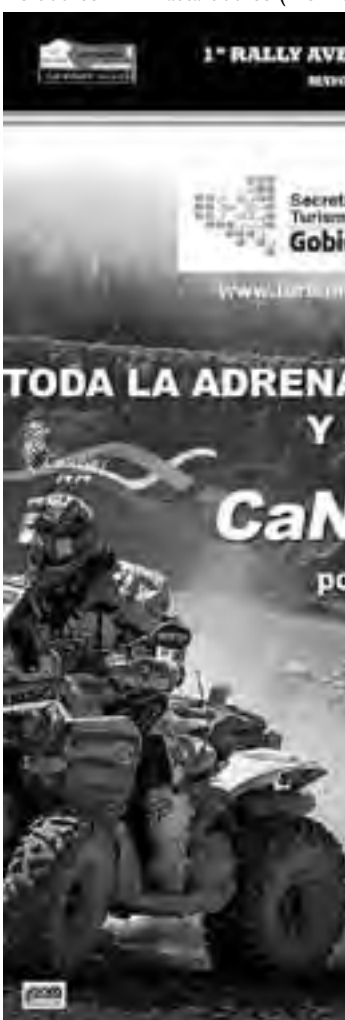
Afiche oficial de la competencia a di

Motos / Num. del 1 al 30: M-1 Ma-2 de 300 cc M-2 Hasta 300 cc (4 o más)