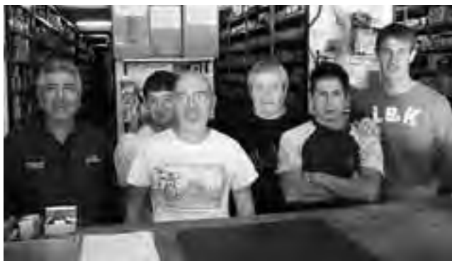
Otro equipo numeroso, el seleccionado de "Continental Repuestos".