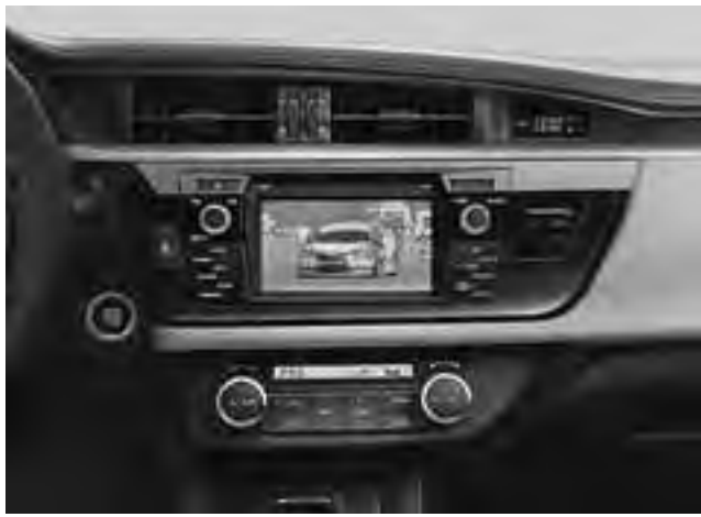
Como principal novedad el modelo Toyota Corolla incorpora TV digital en las versiones Xei, Xei Pack y SEG.

A partir del mes de abril de 2015, el Toyota Corolla presenta mejoras en el equipamiento de todas sus versiones, incorporando tecnología que mejora aún más su oferta competitiva. Como novedad más destacada, las versiones Xei, Xei Pack y SEG adicionan TV digital.