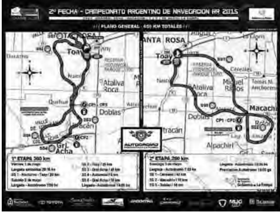
Recorrido oficial de la competencia "1er Rally Aventura La Pampa", 2ª fecha del Campeonato Argentino CaNav.

Lo dijimos en ediciones anteriores, el primer fin de semana largo de mayo cuando se disputa en el Autódromo Provincia de La Pampa la 4ta carrera puntuable de Turismo Nacional, también lo hará por caminos de la Provincia, la especialidad de carrera "rally raid" que organiza CANAV (Campeonato Argentino de Navegación). Es la segunda fecha puntuable 2015 y lleva por nombre "1er Rally Aventura La Pampa". El autódromo de Toay será el Vivac -como en el Dakar- ya que el campeonato de CANAV es similar al Dakar en el que participan pilotos de nivel amateur y profesional (motos, cuadríciclos, autos y camionetas) y es la antesala de entrenamiento para el gran evento internacional "Rally Dakar 2016". Es una carrera de navegación con una hoja de ruta prácticamente igual a la del Rally Dakar, donde se corre a full por caminos irregulares. Para esta fecha la organización espera unos 200 vehículos participantes, entre Motos, Cuatriciclos, UTV y Autos