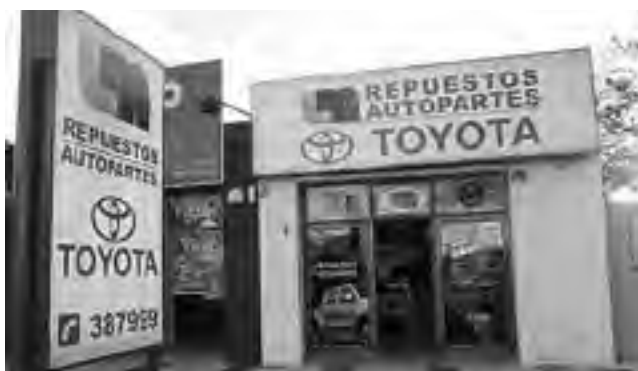
Toda la línea Toyota en "Repuestos Autopartes LM".

Los comercios y empresas presentes en estas páginas adhieren con su saludo al recordarse el "Día Nacional del Repuestero Automotor"