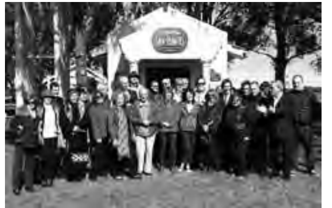
Los presidentes y Consejeros Regionales de la Region Patagonia asistieron al acto.

El viernes 17 de abril fue celebrado el Primer Acto en la República Argentina y mas precisamente en la Capilla San Marcos de la Estancia Villaverde de Santa Rosa, La Pampa, donde fueron incorporados los símbolos distintivos de la Orden del Camino de Santiago, de España.