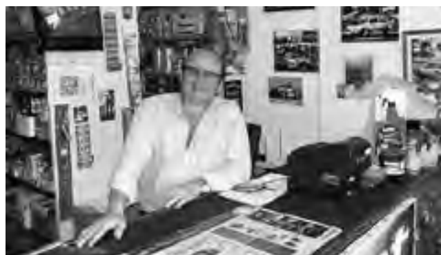
"Planeta Fiat" el universo de la marca en un solo lugar.