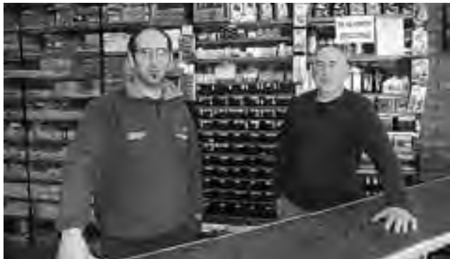
Los muchachos de "Repuestos Santa Rosa", especialistas de alto nivel.

A continuación, ofrecemos al lector una galería de amigos repuesteros que siempre nos acompañan con su presencia publicitaria en cada una de nuestras producciones. No se olviden de saludarlos: