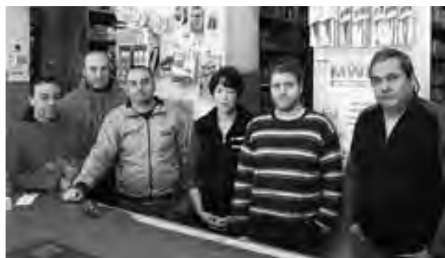
El equipo de "Repuestos El Porteño" en un alto en boxes.

Los comercios y empresas presentes en estas páginas adhieren con su saludo al recordarse el "Día Nacional del Repuestero Automotor"