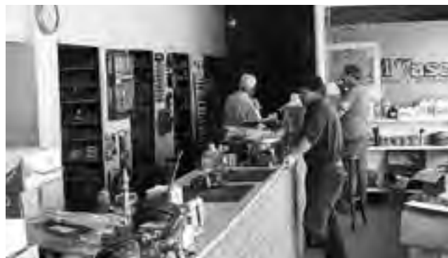
"Frenos El Vasco", un clásico de la especialidad en la ciudad.